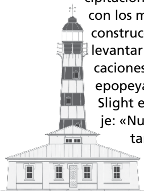
Faro Bahía Félix.

Faros en torno al Estrecho de Magallanes. http://faros.cl