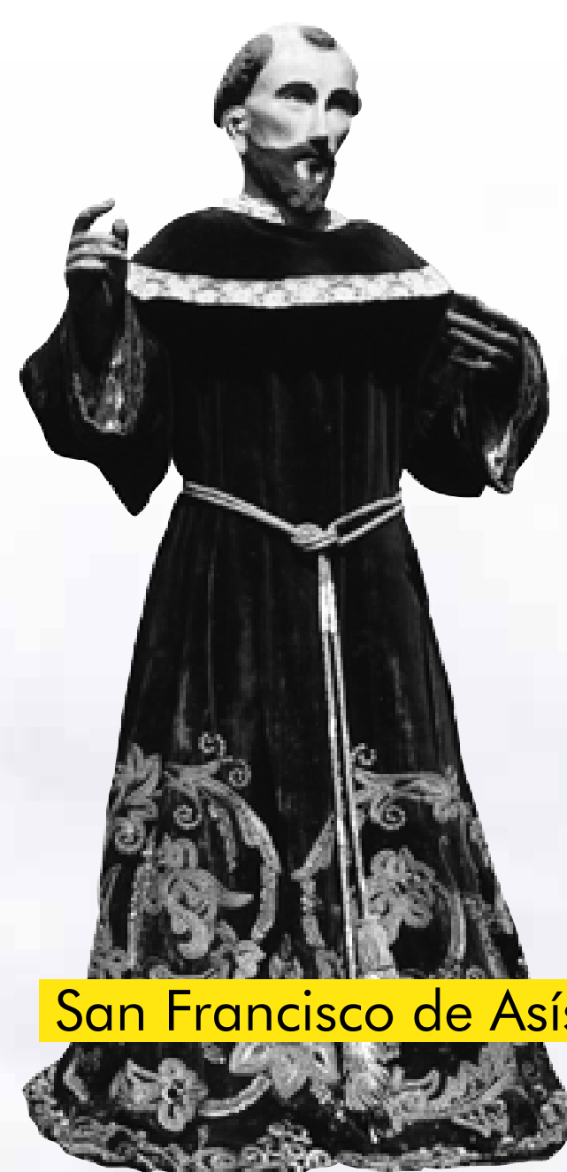
San Francisco de Asís.

Así, podían ser avistadas por los navegantes, además de acceder a ellas desde el mar. En el archipiélago, existen más de 150 iglesias o capillas. De ellas 16 –además de ser monumentos nacionales– fueron declaradas Patrimonio de la Humanidad por la UNESCO en 2000.