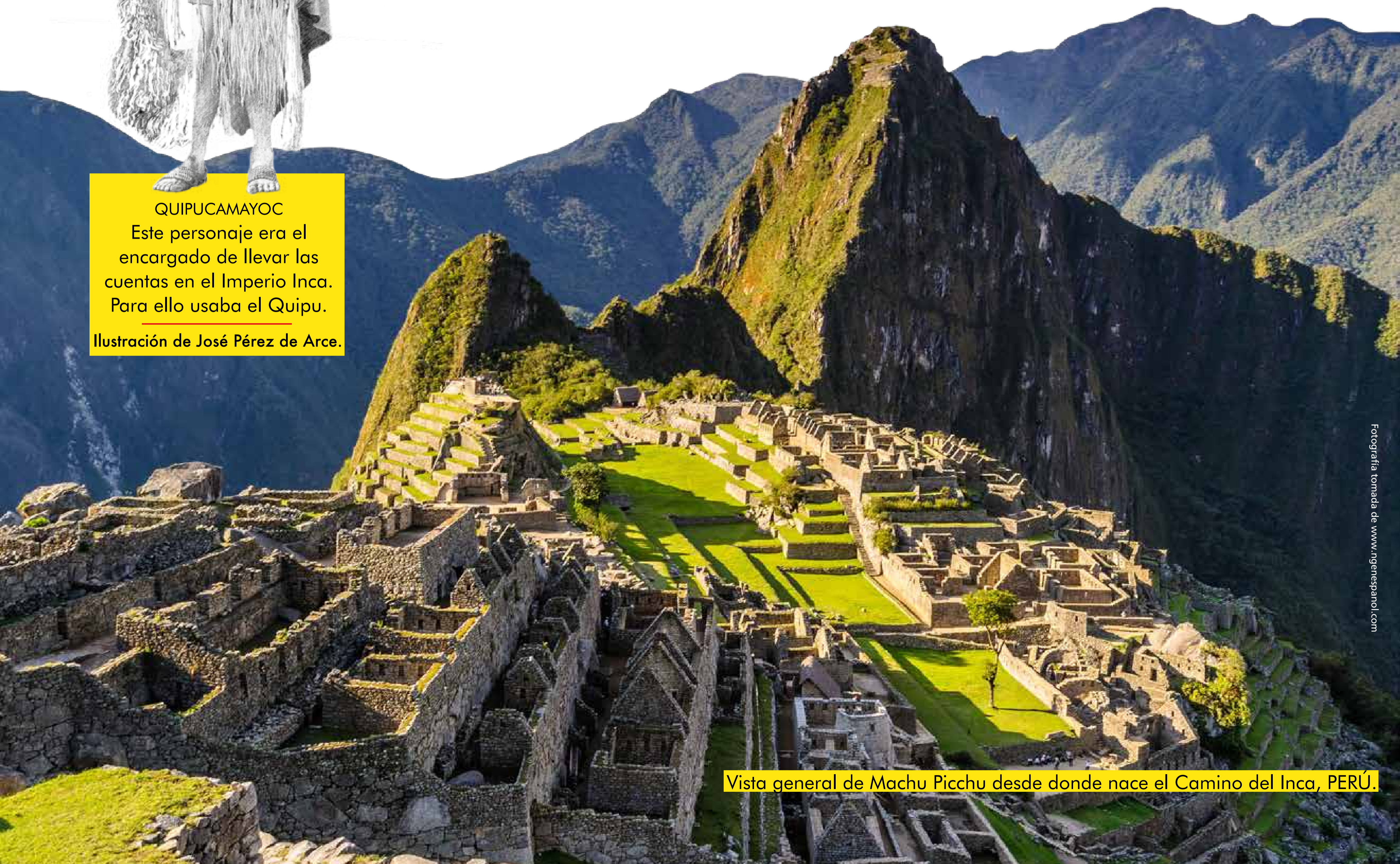
Vista general de Machu Picchu desde donde nace el Camino del Inca, PERÚ.