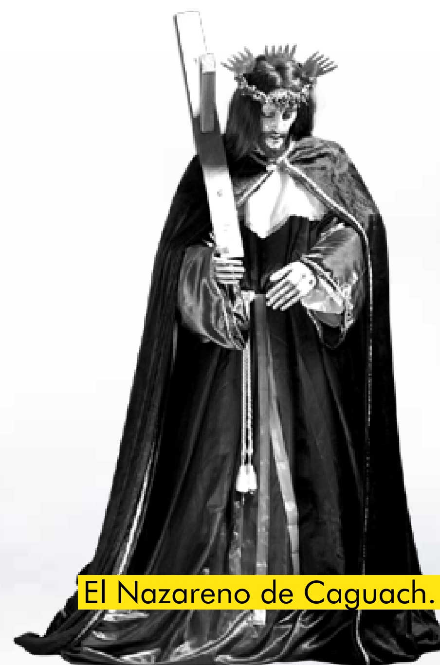
El Nazareno de Caguach.