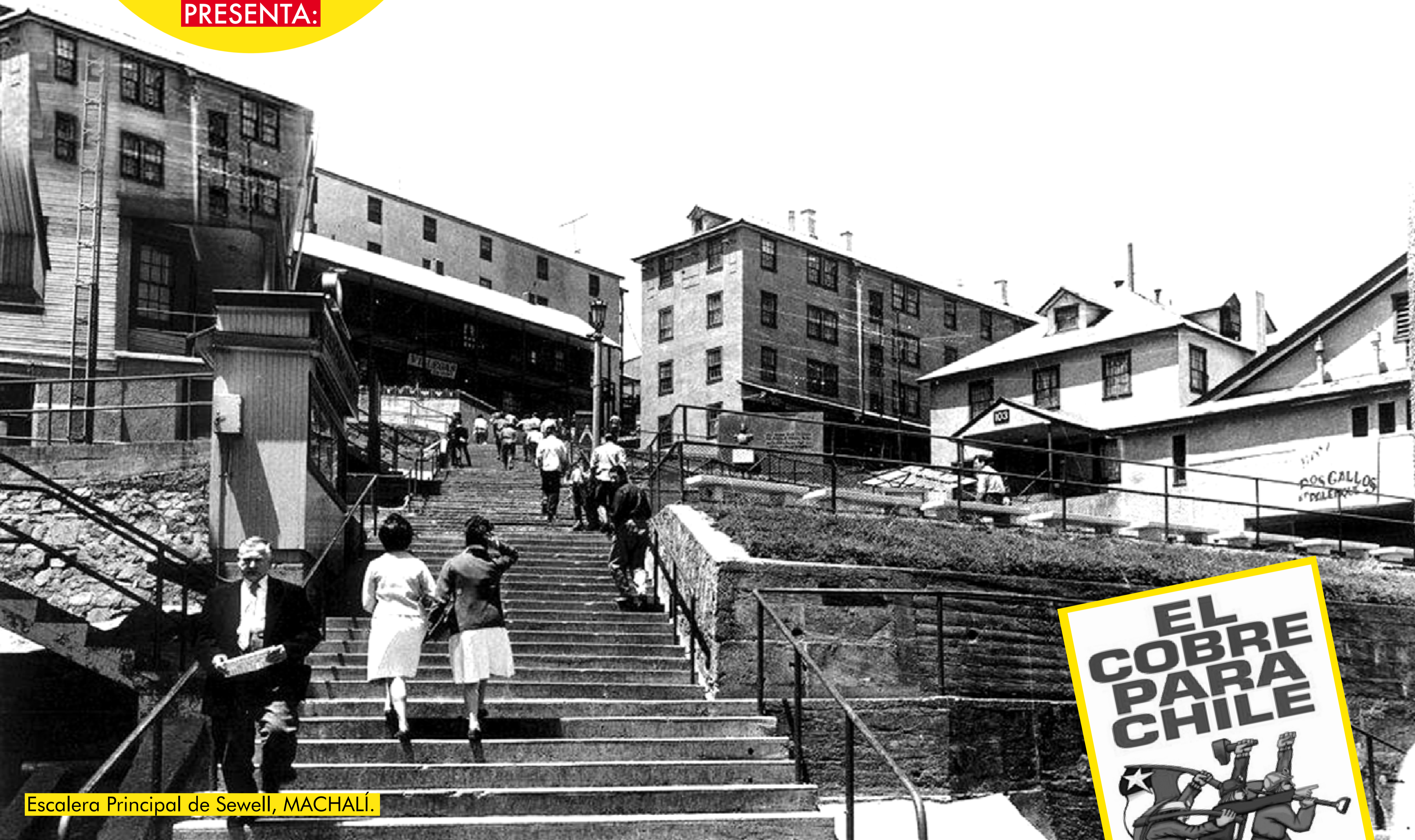
Escalera Principal de Sewell, MACHALÍ.

Corría 1905. Internado en el Cerro Negro, en plena cordillera de Los Andes, a 2.200 metros sobre el nivel del mar y a 60 km al oriente de Rancagua, nace Sewell, el primer asentamiento minero-industrial de montaña vinculado a la mina El Teniente, la mayor de cobre subterráneo en el mundo. En 1968, en su época de máximo apogeo, contaba con 15.000 habitantes, de los cuales 30% era norteamericano.