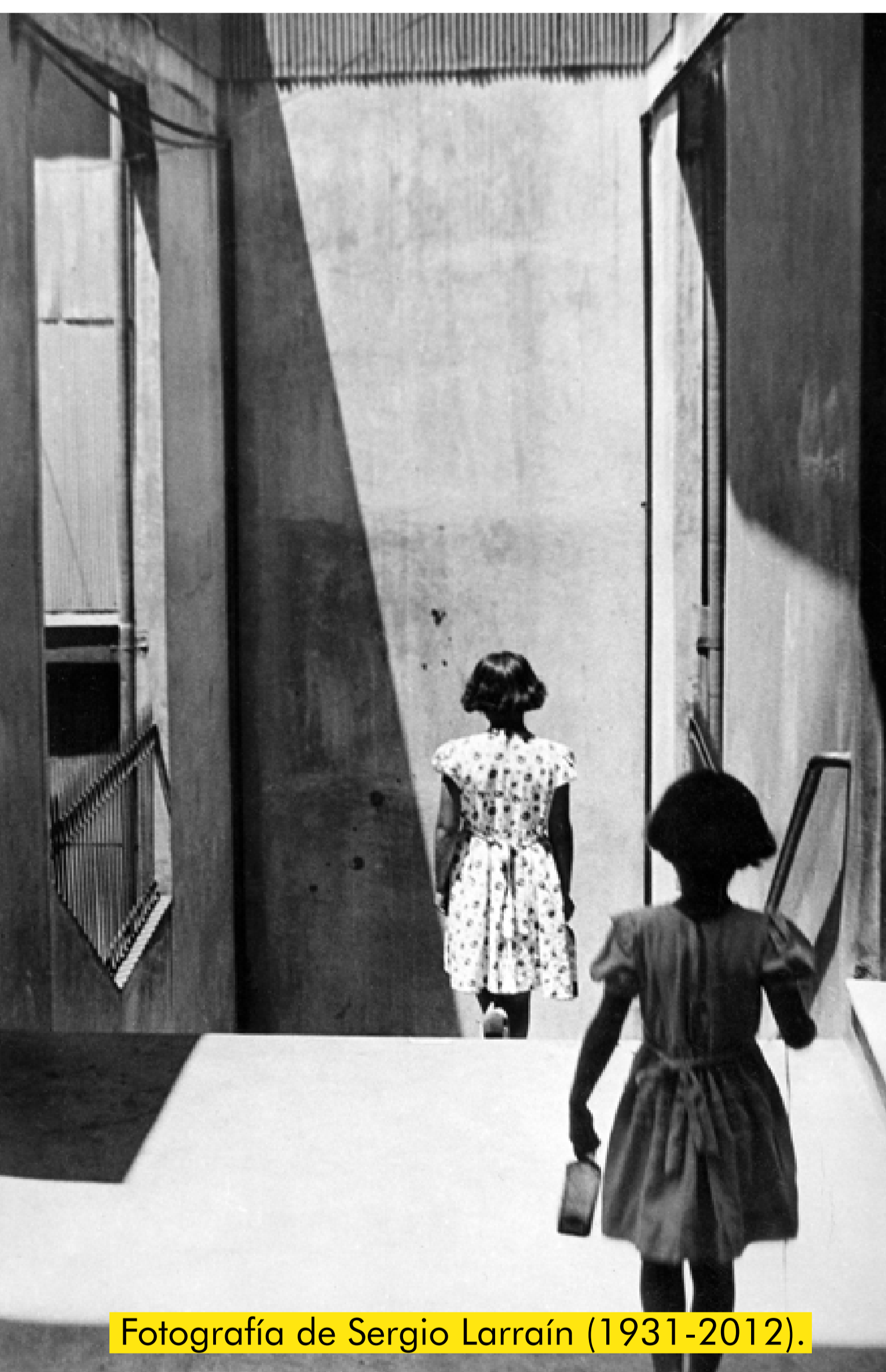
Fotografía de Sergio Larraín (1931-2012).