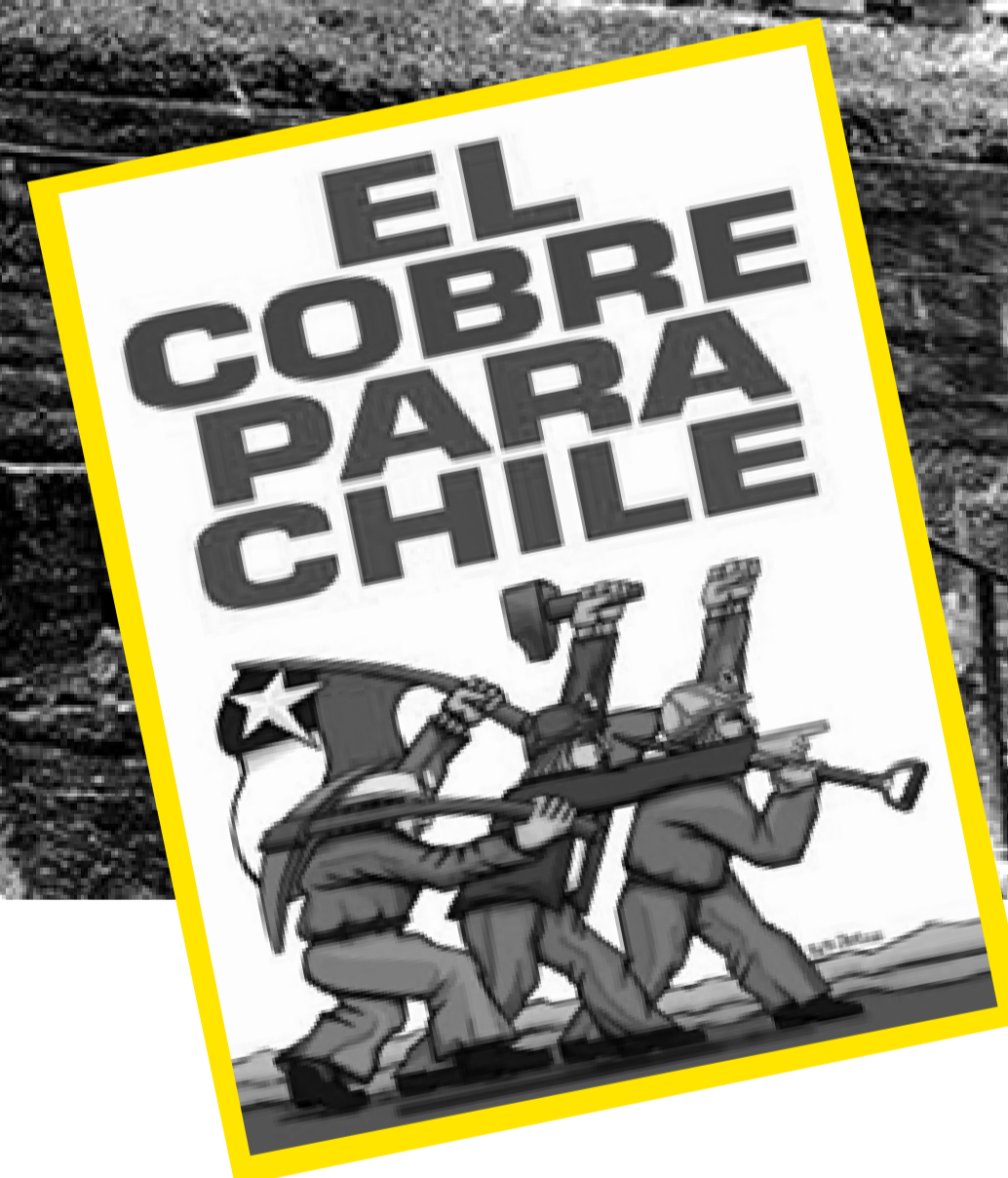
Propaganda en torno a la "Nacionalización" del cobre en 1971.

En ese mismo tiempo se construyó la carretera del cobre, los sewellinos fueron trasladados a Rancagua, vino la "chilenización" (1969) y la bullada "nacionalización" del cobre (1971). Luego, en 1998 –año en que se cerró definitivamente el campamento– este fue declarado Monumento Nacional además de Zona Típica y, en 2006, Patrimonio de la Humanidad.