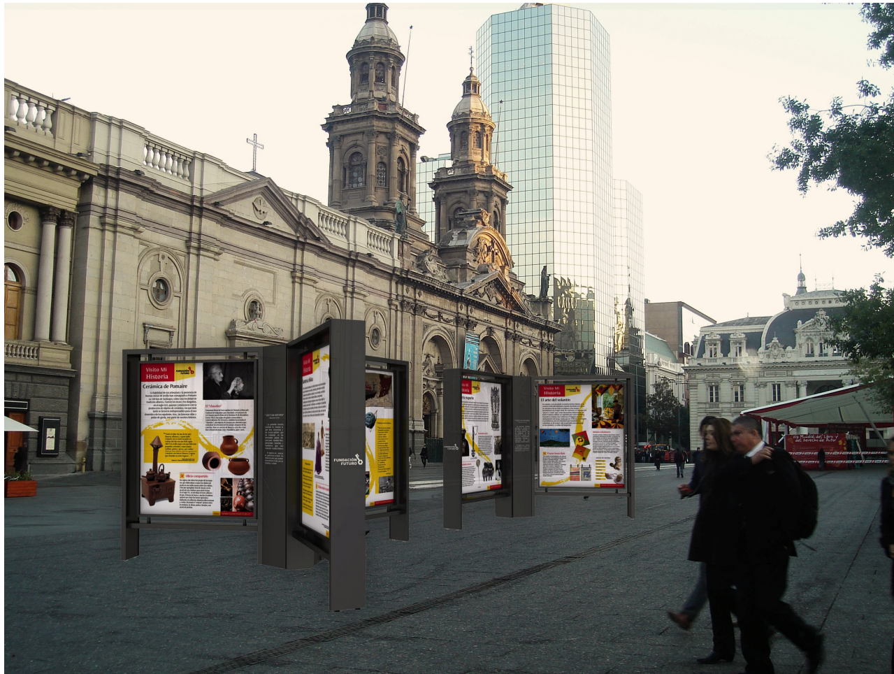
Fotomontaje Plaza de Armas, Santiago.