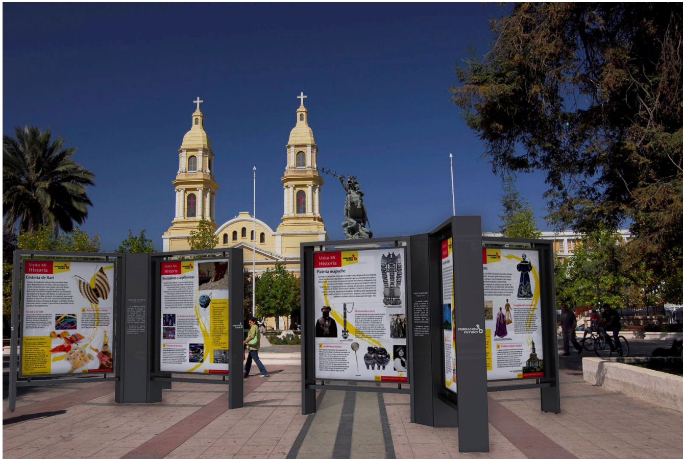
Fotomontaje Plaza de Los Héroes, Rancagua.