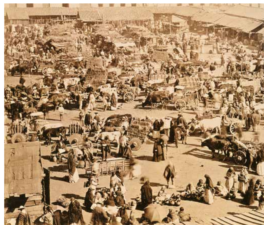
La Plaza Sargento Aldea o Plaza del Mercado hacia 1885.

Luego, se agregó la venta de leña, carbón, aves, cerdos y flores. Se fue ampliando con cocinerías y puestos de artesanía local. El más ilustre de los clientes ha sido Pablo Neruda, que, según cuentan, “lo miraba todo y nunca tenía prisa”.