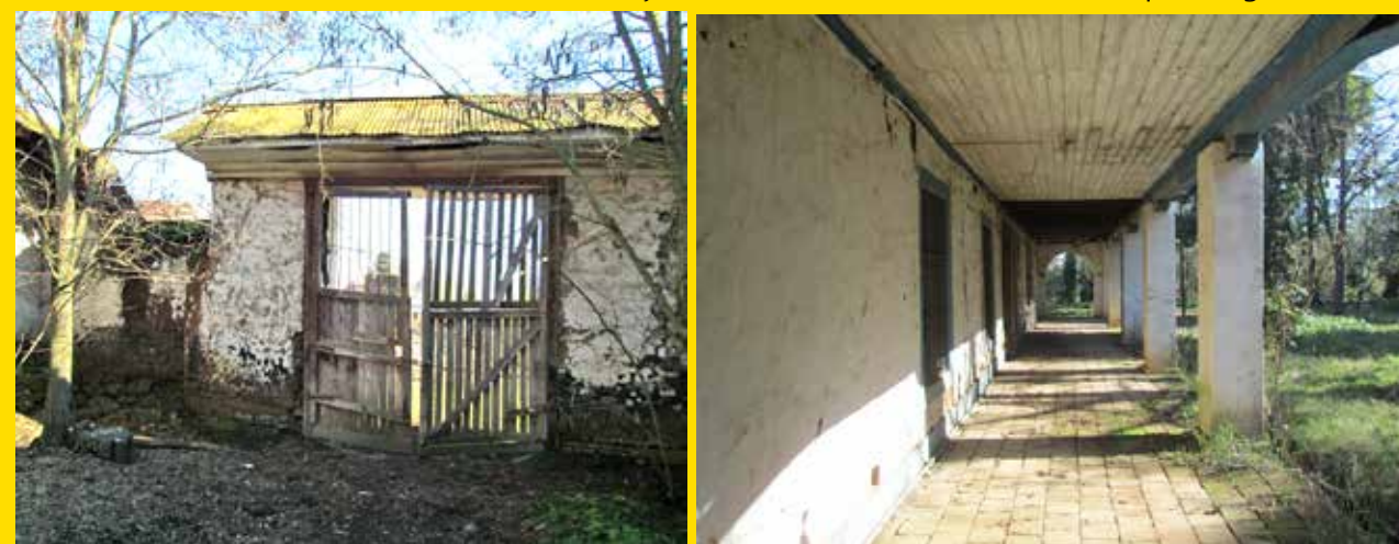
Fotografía de Claudio Muñoz de Espinoza - tomada en 1997/1998/1999