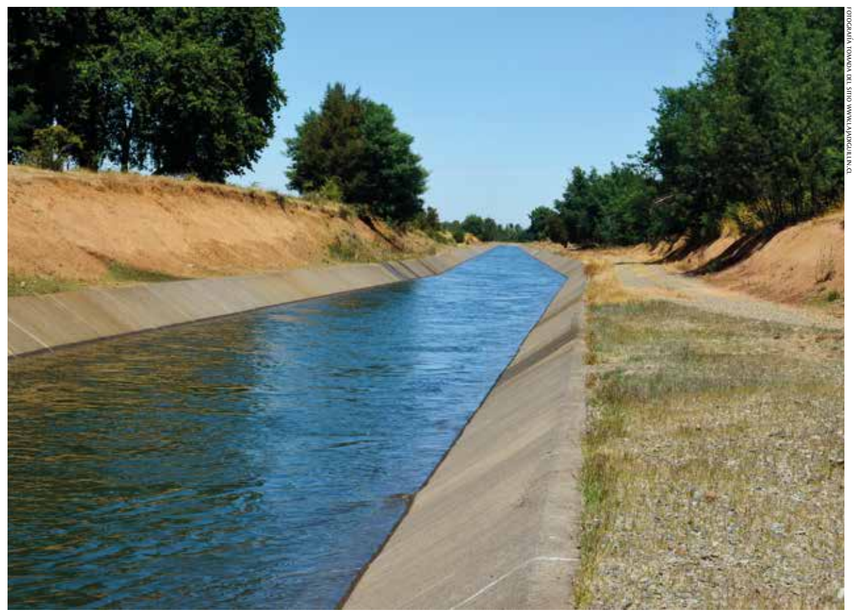
Aunque no a toda su potencialidad el canal Laja-Diguillín fue inaugurado en 2008.