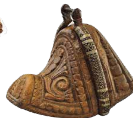
Colección Museo de Arte Popular Americano – MAPA. Universidad de Chile.