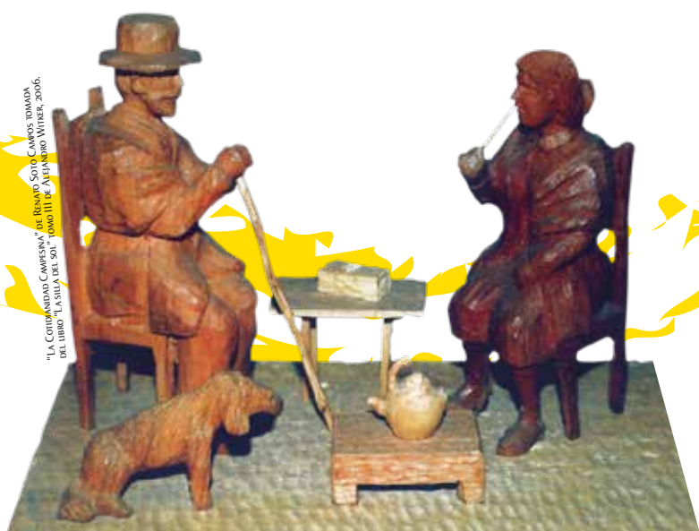
El mate fue costumbre propia de las haciendas de Chile central.