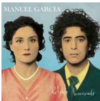
“Retrato Iluminado” es el último disco de Manuel García, lanzado en 2014.

“Mejillones” fue compuesta en 1938, junto a “Antofagasta dormida”, por Gamelín Guerra Seura (1906-1988). Nacido en la oficina salitrera “Pepita”, después del Servicio Militar trabajó como obrero en el ferrocarril Antofagasta-La Paz, pero dejó el trabajo por la crisis del 29. De allí a Santiago, donde inició su carrera musical, llegando a ser la voz más popular de las emisoras de los años '40. En 1971 se le otorgó el premio “Ostión de Oro” y fue declarado Hijo Ilustre de Mejillones. Unos años más tarde, se inauguró el Centro Cultural Gamelín Guerra.