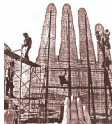
Construcción de “La Mano del Desierto” de Irarrázabal.