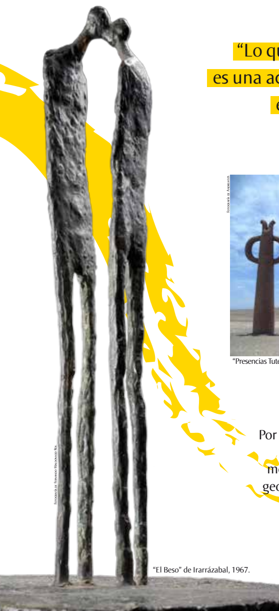
“El Beso” de Irarrázabal, 1967.