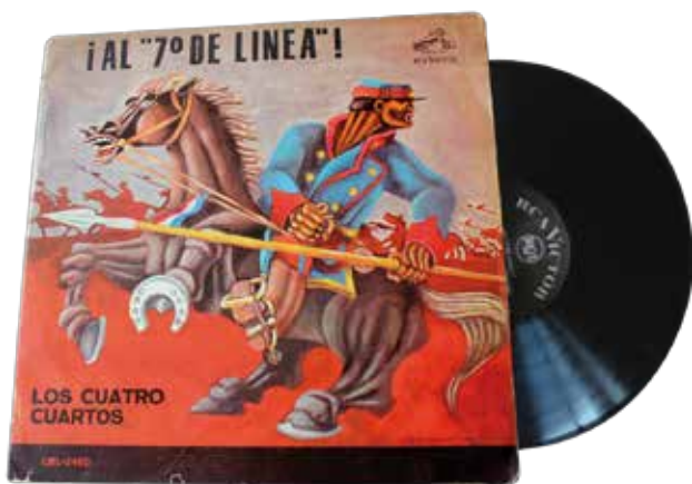
“¡Al 7º de Línea!” es un vinilo grabado por Los Cuatro Cuartos en 1966, y relanzado en formato CD y casete en 1998. Una de sus canciones, “Los viejos estandartes”, se inspiró en la triunfal llegada del general Baquedano a Valparaíso en 1881.