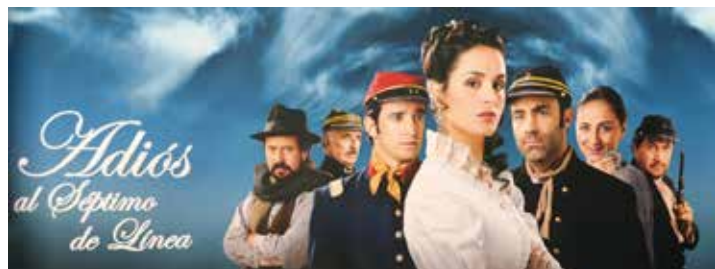
En 2010, con motivo del Bicentenario, se emitió por tv la miniserie “Adiós al Séptimo de Línea”, dirigida por Alex Bowen.

“Adiós al Séptimo de Línea” fue originalmente un radioteatro transmitido por Radio Nacional en el famoso programa “El gran teatro de la historia”. Fue tal su éxito, que Inostrosa se contactó con Editorial Zig Zag para transformar el guión en novela histórica. Publicada en 1955, el primer año se vendieron 225.000 ejemplares, y se publicó un resumen de la obra en forma de historieta. En 1975, cuando murió Jorge Inostrosa, se habían vendido más de cinco millones de ejemplares.