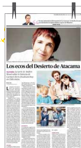
Fragmento de “El Diario de Atacama” (11/09/2013).