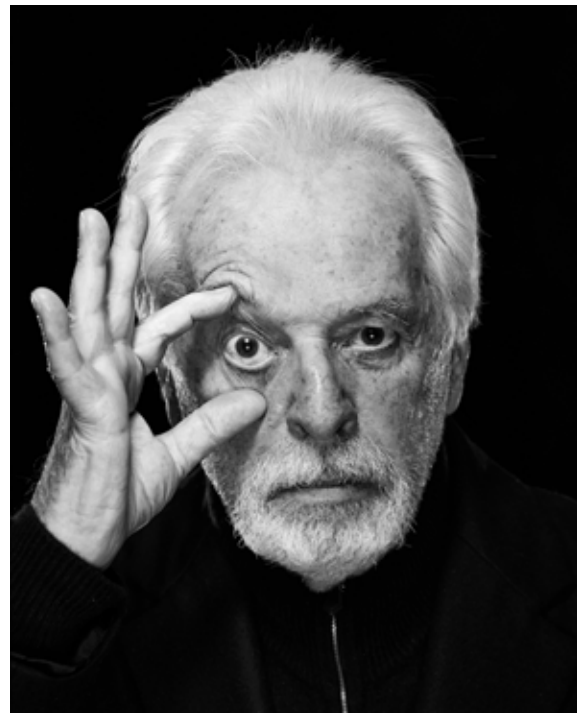
Después de 75 años volvió a Tocopilla, que estaba intacta, salvo La casa Ukrania, la tienda de su padre que él reconstruyó para la película.

Otras obras de la pantalla grande inspiradas en el norte son “Nostalgia de la luz” y “Ecos del Desierto”.