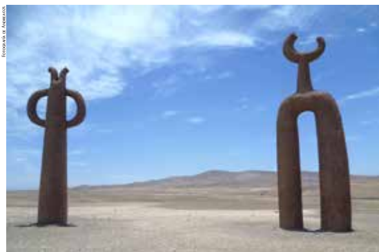
“Presencias Tutelares” monumento realizado con aporte del Fondart.