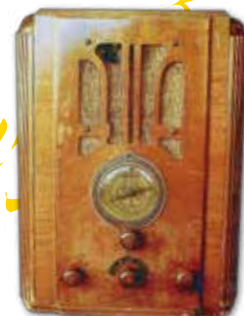
En radios como esta antigua Crosley, en la década del '50 miles de chilenos escucharon el radioteatro “Adiós al Séptimo de Línea”.

Conjunto formado en 1962 por Pedro Messone, Luis Urquidí, Willy Bascuñán y Fernando Torti. En 1965 ganaron en la categoría competencia folclórica del Festival Internacional de la Canción de Viña del Mar con la canción “Mano Nortina”.