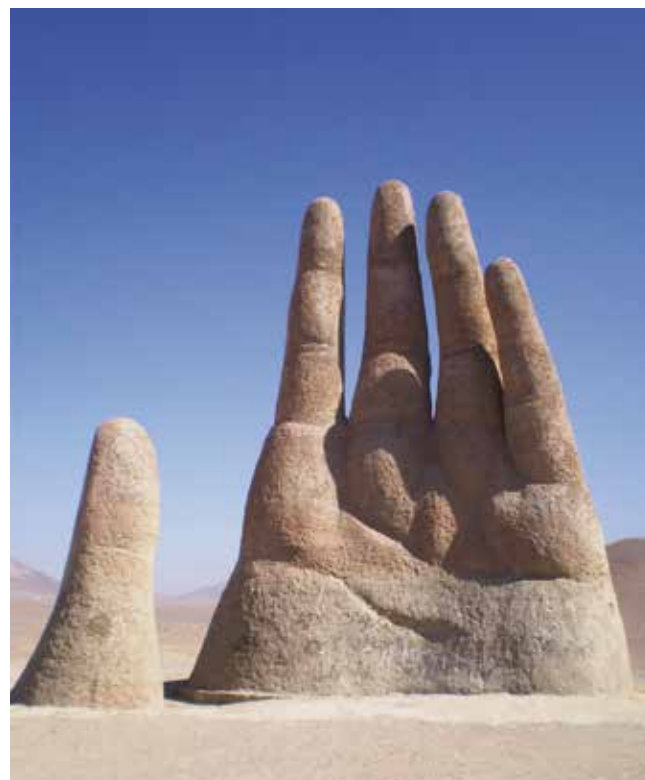
La Corporación Pro Antofagasta es la encargada de la mantención y restauración de “La Mano del Desierto”.

En medio del desierto de Atacama, 75 km al sur de Antofagasta, se asoma la escultura de una mano ni más ni menos que de ¡11 metros de altura! En 1922 el escultor chileno Mario Irarrázabal (1940) inauguró la que se considera su obra maestra: “La Mano del Desierto”. Sus manos monumentales hechas de hierro y cemento, se reparten también por Punta del Este (Uruguay), Venecia (Italia) y Madrid (España). Asimismo, el Norte Grande acoge en pleno desierto otras esculturas monumentales como: “Hito Monumental del Trópico de Capricornio” y “Presencias Tutelares”.