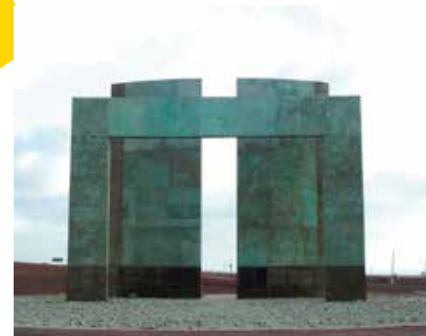
El monumento permite calcular las estaciones y seguir los movimientos aparentes del Sol durante el año.

Por iniciativa del Rotary Club de Antofagasta, se encargó a la arquitecta Eleonora Román la creación de un monumento al Trópico de Capricornio. Sus proporciones geométricas y astronómicas destacan este hito que es a la vez un calendario solar. Fue inaugurado el 21 de diciembre de 2000, día del solsticio de verano. Está compuesto por el Arco de Capricornio, el Camino del Sol, las Puertas del Sol y el Círculo del Mundo.