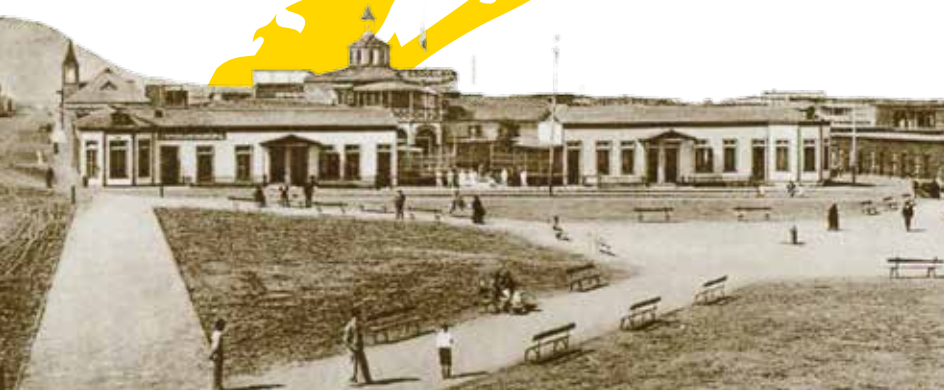
Vista de la Escuela de Hombres N°1 Domingo Santa María en 1904. Esta recibe su nombre en recuerdo del que fuera presidente de Chile entre 1881 y 1886.