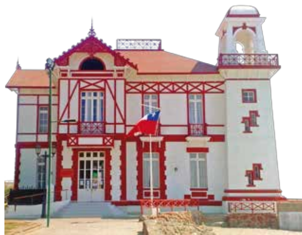
Capitania de Puerto de Mejillones.

En 1968 se filmó “Ayúdeme usted compadre”, dirigida por Germán Becker, una de las películas musicales más taquilleras del cine chileno. Sus protagonistas fueron: Los Perlas, Los Huasos Quincheros, Pedro Messone, Fresia Soto, Gloria Simonetti, Arturo Gatica, ¡hasta Sergio Livingstone!, que actuaba como presentador del espectáculo en la película. Por supuesto que dentro de las canciones del film estaba la popular “Mejillones”, entonces interpretada por Los Gatos.