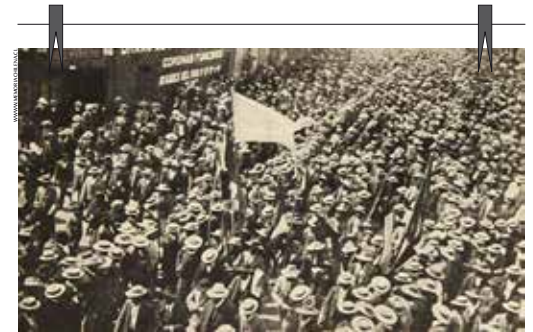
Grupo de obreros dirigiéndose a la Escuela Santa María, 1907.