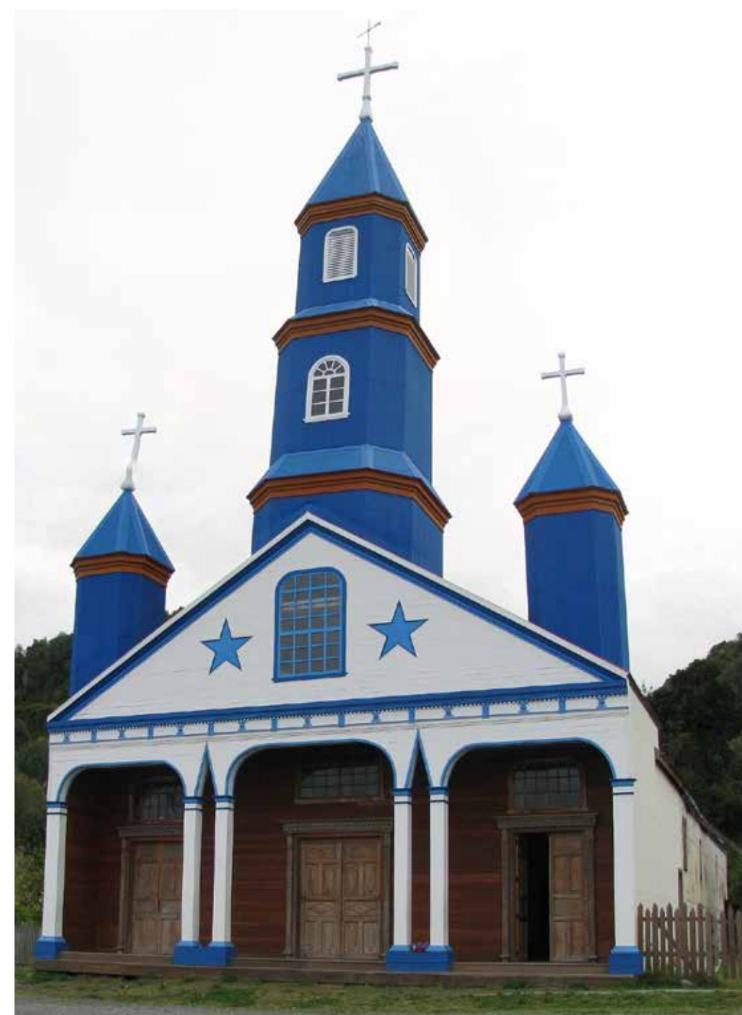
La Iglesia Nuestra Señora del Patrocinio de Tenaún.

Levantadas con maderas nativas y adornadas con la tradicional santería chilota, son más de 70 las iglesias que se reparten por el archipiélago. De ellas, 16 fueron declaradas Patrimonio de la Humanidad por la Unesco el 2000. Son testimonios de la obra evangelizadora que llevaron a cabo los jesuitas desde su llegada a la Isla en 1608 y que fue continuada por los franciscanos. La más antigua es la Iglesia de Achao, que dataría de 1740. La más grande está en Quinchao y la más sencilla en Colo. También destaca la de Caguach, por ser sede de la festividad más importante del Archipiélago. Todas siguen siendo custodiadas por los “fiscales”, laicos que reemplazan las funciones del párroco.