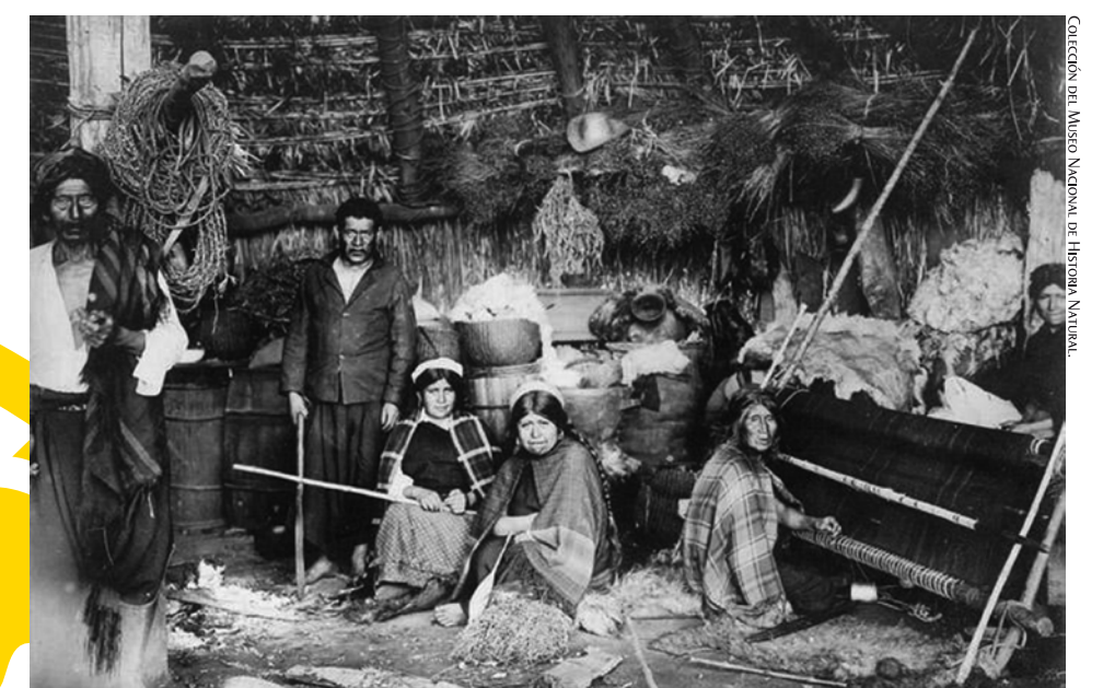
Familia mapuche al interior de una ruka, 1890.

POETA OSORNINO BERNARDO COLIPÁN (1967), EN LA PRESENTACIÓN DE SU LIBRO “FORRAHUE, MATANZA DE 1912”. U. AUSTRAL DE CHILE.