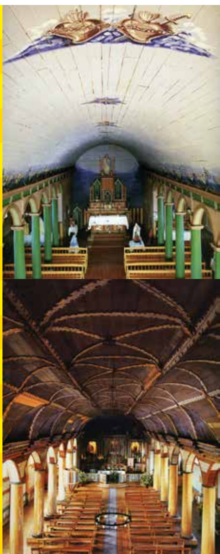
Interiores de las iglesias: Santa María de Loreto de Achao y Nuestra Sra. de La Candelaria de Puchilco

Colo San Juan Tenaún Dalcahue Castro Achao Caguach Nercón Rilán Quinchao Vilipulli Aldachildo Chelín Ichuac Chonchi Detif