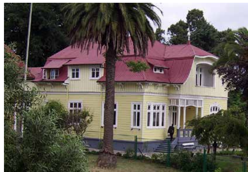
Casa Prochelle, VALDIVIA.