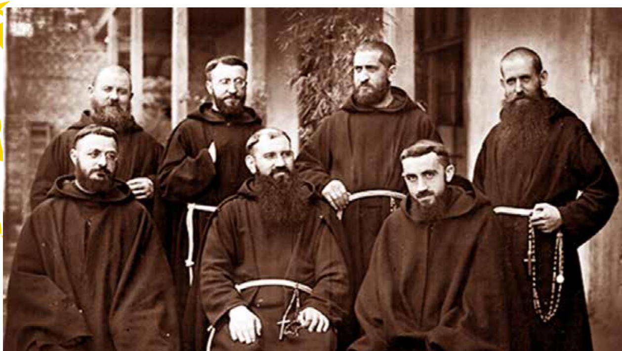
Monjes capuchinos en la zona de Panguipulli de principios del siglo XX.