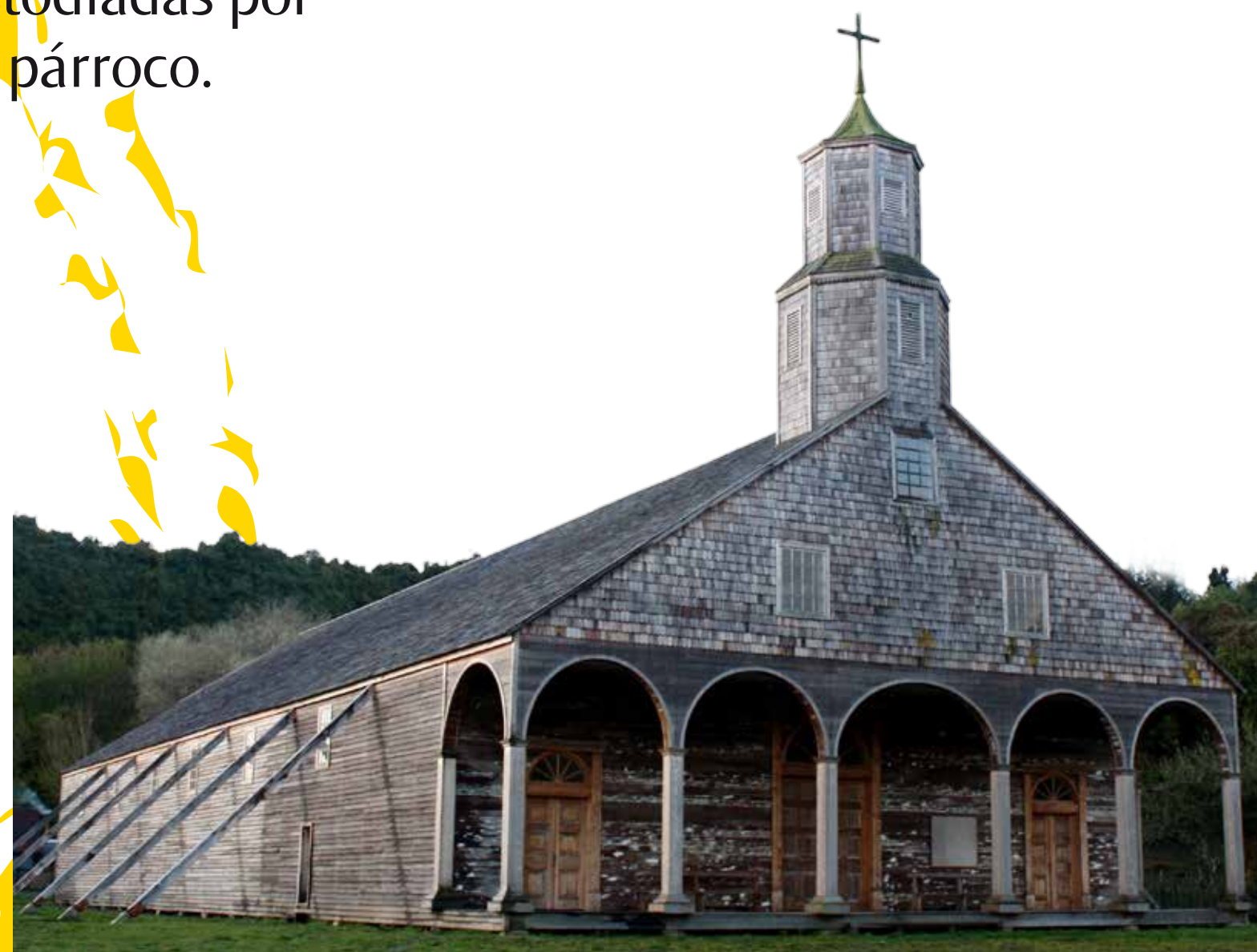
La Iglesia de Quinchao fue restaurada en 2010 por la Fundación Amigos de las Iglesias de Chiloé.