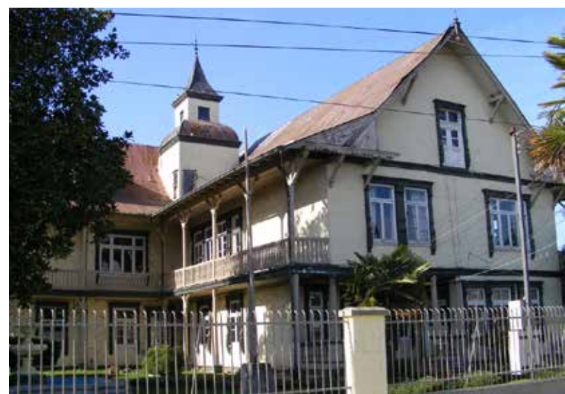
Casa Furniel, RÍO BUENO.