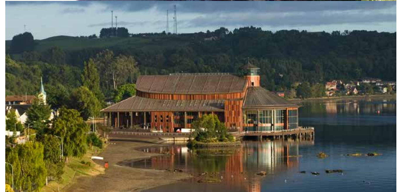
De arriba a abajo, el Museo de Arte Moderno de Chiloé (MAM), el Museo de Arte Contemporáneo de Valdivia (MAC) y el Teatro del Lago de Frutillar.