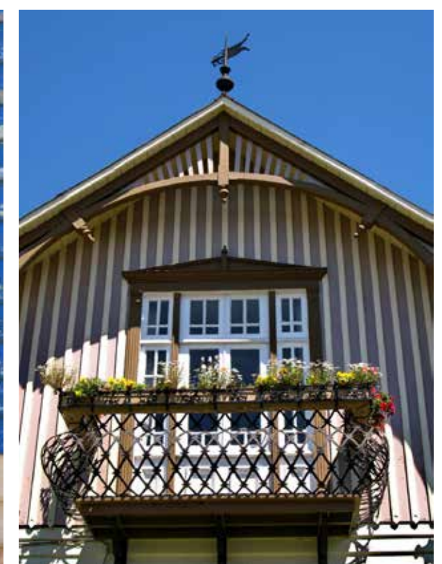
Detalles arquitectónicos de las casas de los colonos alemanes en la zona.

“En Osorno se produce una escuela local de construcción de madera, caracterizada por la repetición de elementos volumétricos, como las torres asimétricas”.