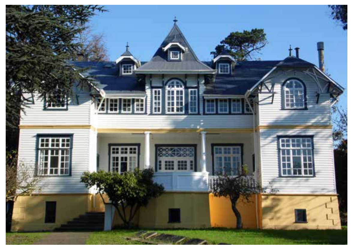
Casa Hollstein Chuyaca. OSORNO.

La colonización alemana en las regiones de Los Ríos y Los Lagos produjo una verdadera revolución arquitectónica. La primera generación de colonos debía, en el plazo de un año, construir una casa, trabajar el suelo y cercar el predio. Tal exigencia hizo que sus casas fueran sencillas, funcionales y simples. Sin embargo, al poco tiempo, la realidad cambió. Crearon una industria de recursos regionales (especialmente maderas nativas) e importaron materiales de construcción prefabricados que facilitaron la incorporación de nuevos elementos arquitectónicos que le dieron el “toque romántico” a las ciudades del sur. Muchas de las casas de estos colonos son Monumento Nacional.