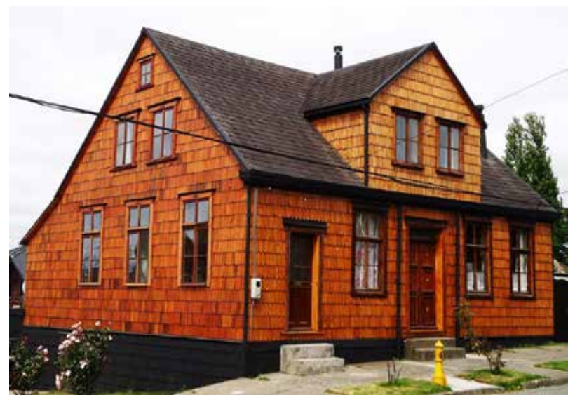
Casa Gotschlich, PUERTO VARAS.