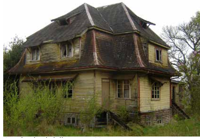
Casa fundo El Llolly, PAILLACO.

GABRIEL GUARDA OSB, “LA TRADICIÓN DE LA MADERA”. Ed. UC, 1995.