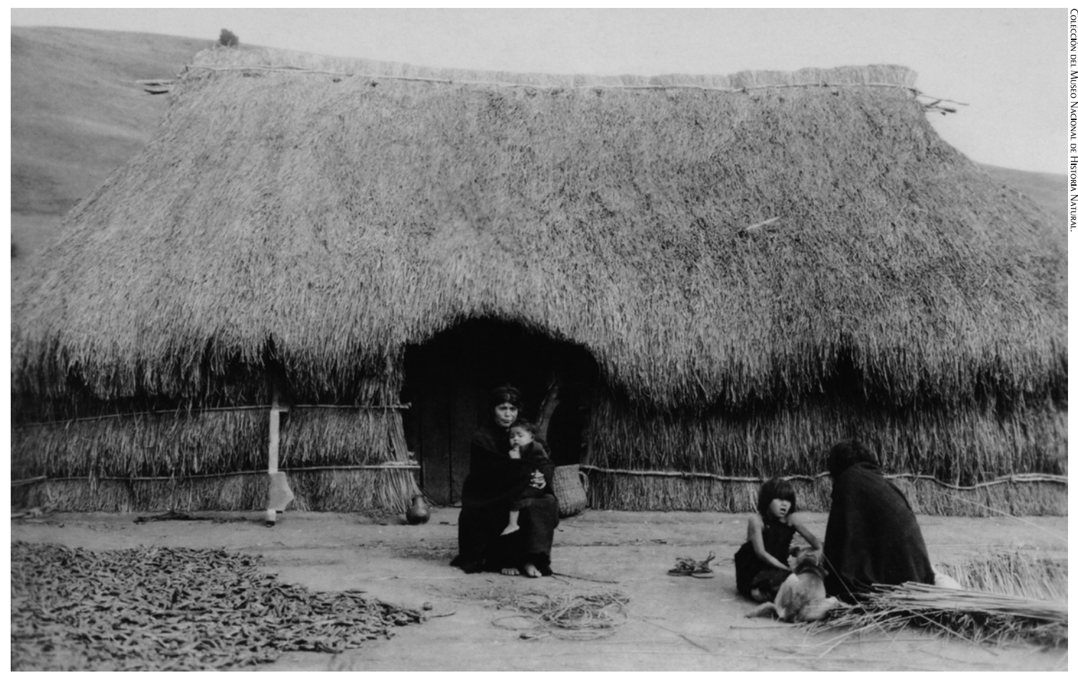
Exterior de una ruka mapuche.

¿Existen cementerios mapuches sagrados desde los cuales se inicia el “viaje” hacia el oriente o Puel Mapu? Sí. Uno de ellos es el “eltun” de Forrahue, en Osorno. Asimismo, en Río Bueno el “Complejo Religioso y Ceremonial Nogyehue” que incluye un menoko (sitio que cumple funciones mágicas) y un cementerio. Ambos son Monumentos Nacionales. Otro tipo de arquitectura propia del mundo mapuche es la ruka (casa), construida con madera y fibras vegetales. Inserta en el Mapu (tierra), tiene una puerta de acceso orientada hacia la salida del sol, y en el centro mantiene un kutzalwe (fogón).