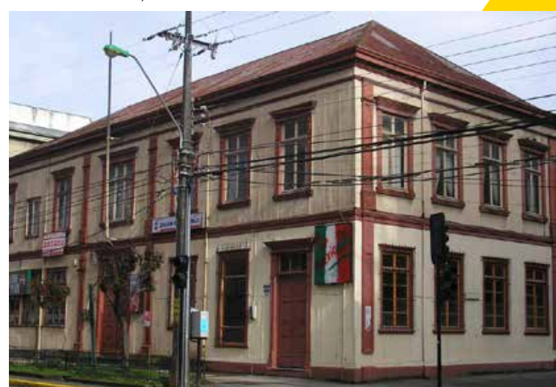
Casa Pauly, PUERTO MONTT.