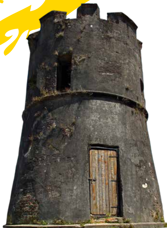
Torreón Los Canelos, Valdivia.

La isla albergó dos fortalezas, entre ellas, el Castillo San Pedro de Alcántara, que incluía un foso, baluarte, quince piezas de artillería y los conventos de San Francisco y San Agustín.