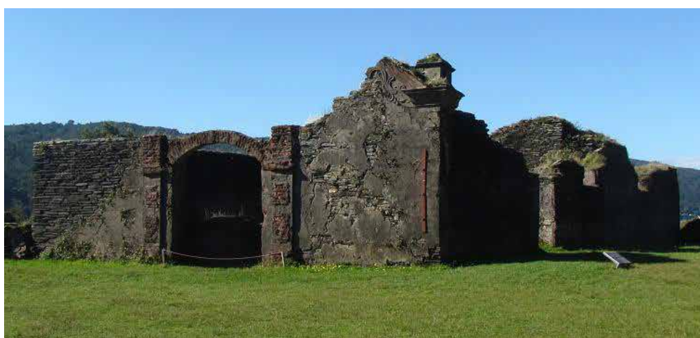
Vistas de los fuertes y castillos de fin de mundo.