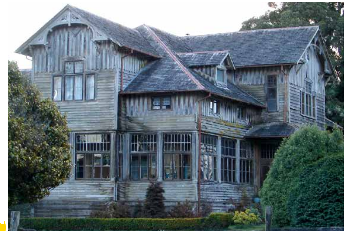
Casona Alemana, PUERTO FONK.

“En Valdivia las estructuras de madera se revisten de metal. Dado su carácter portuario, jamás se usó aquí la tejuela”.