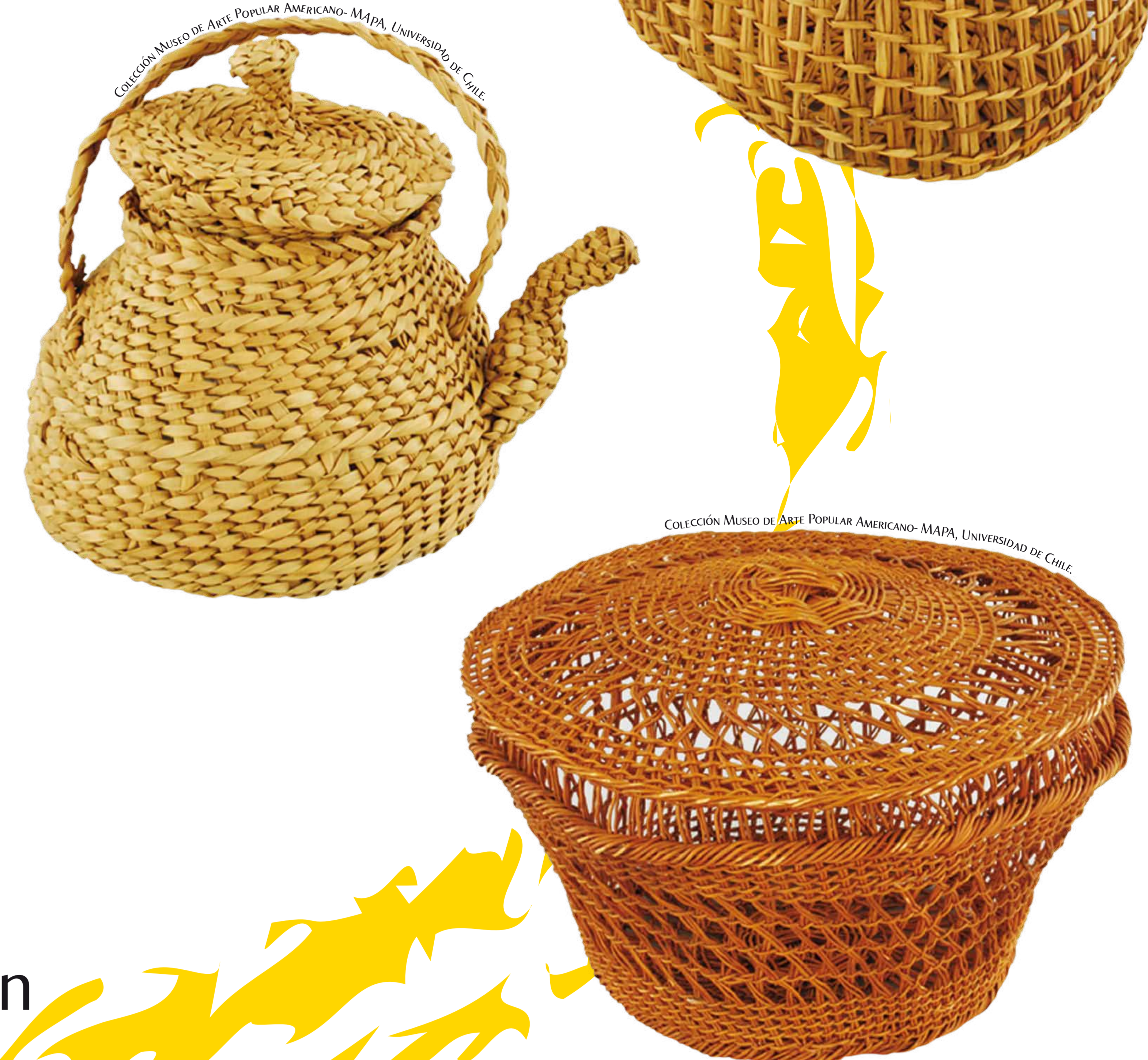
Los centros de producción de cestería chilota son San Juan (Dalcahue), Chaiguao (Quellón), San Javier (Curaco de Velez) y Llingua (Quinchao).

Chiloé es considerado un centro cestero de gran importancia nacional por la variedad de fibras vegetales utilizadas, las que provienen de plantas y enredaderas que crecen en bosques, humedales y en los mismos patios. Se trata de una artesanía de raíz indígena y mestiza que preserva las técnicas locales. Con los siglos, las creaciones han ido cambiando. Antes se tejían objetos para las faenas de la vida diaria: canastos para mariscar, hacer chicha, cosechar papas o aventar el trigo; también sogas para atar animales o amarrar los botes. Desde las décadas del 60' y 70', comienzan a ser confeccionadas piezas de carácter más bien decorativo, como cuelgas de pájaros y figuras de la mitología chilota. Además de lámparas, mates, teteras y tazas hechas con gran talento y delicadeza.