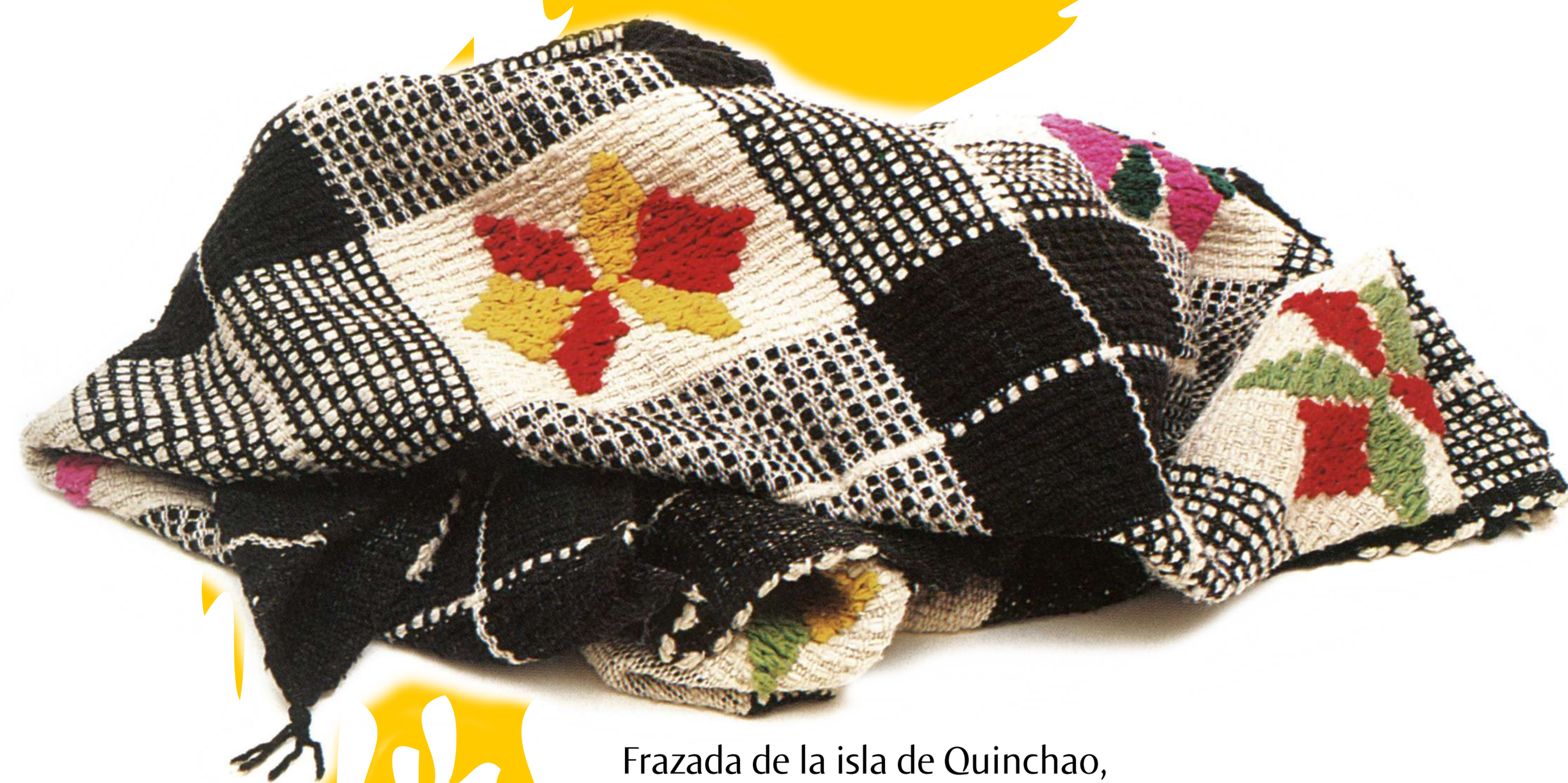
Frazada de la isla de Quinchao, cuyos coloridos se obtienen de raíces, cortezas, hojas, minerales y también tinturas.