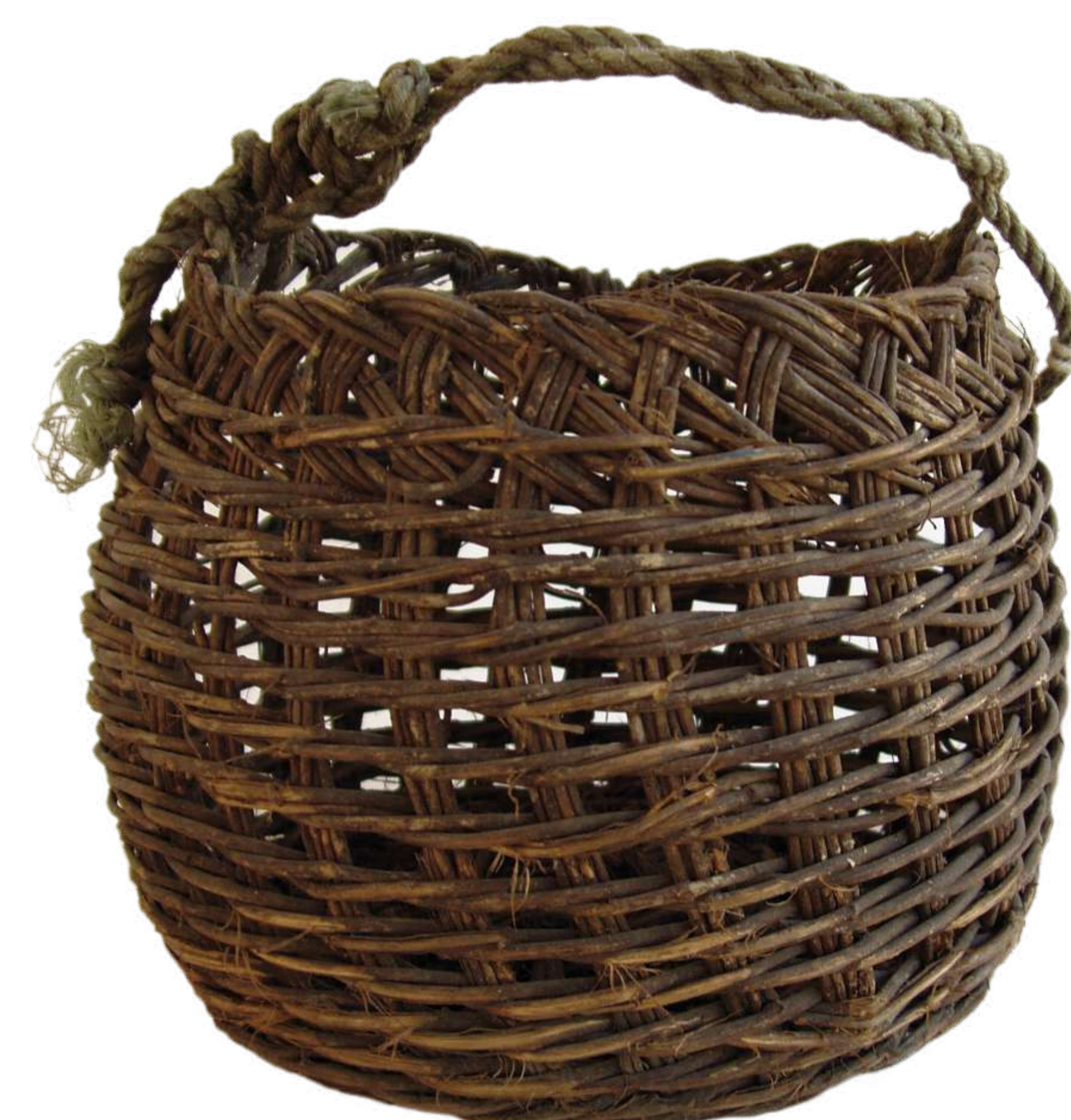
Este antiguo canasto chilote forma parte de la colección del Museo Regional de Ancud