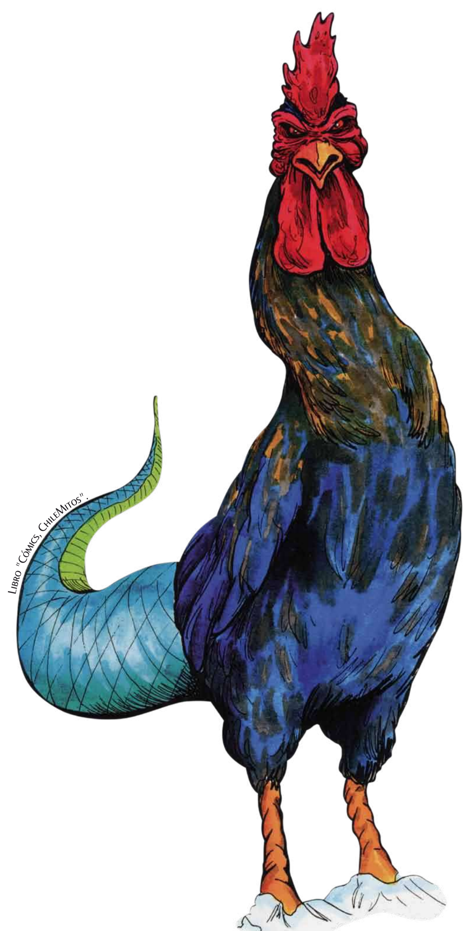
El Basilisco es una culebra con una cresta en la cabeza y alas de murciélago. Dicen que su potestad es matar con la mirada.