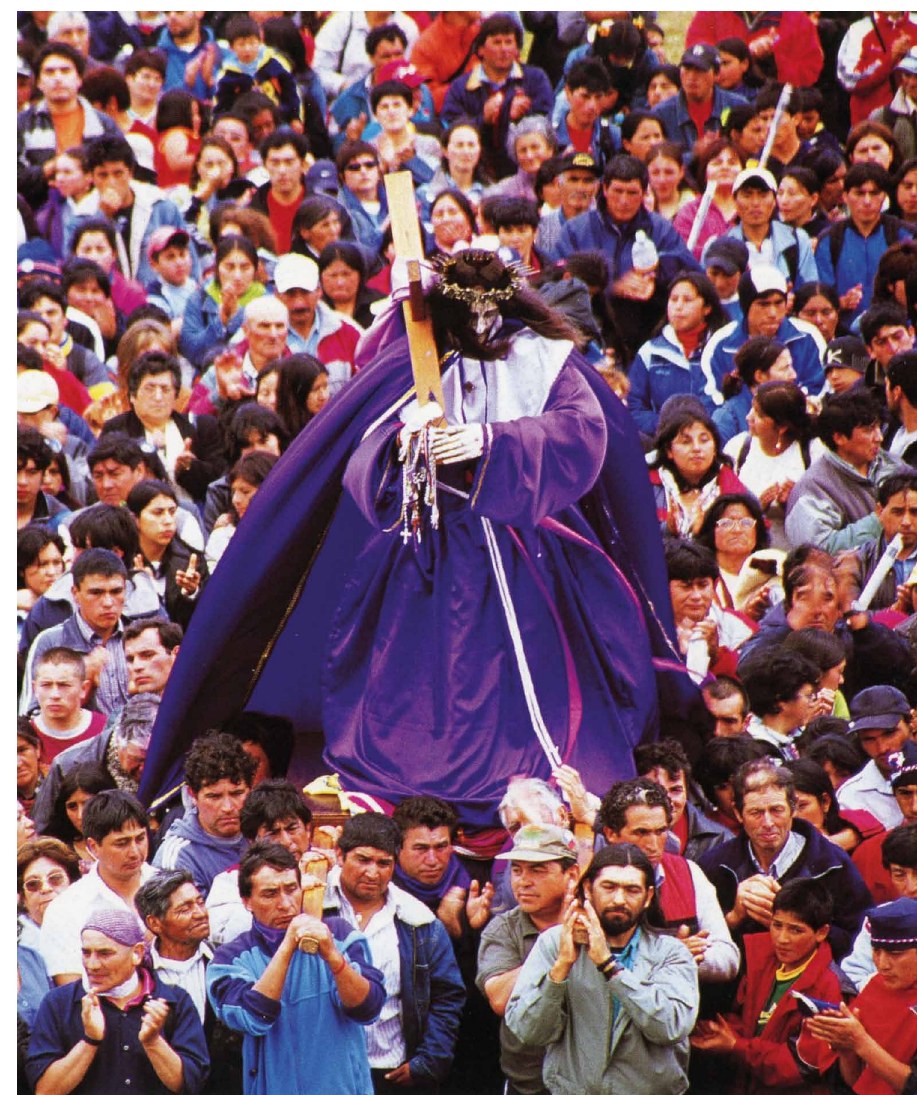
Caguach es el centro ceremonial más importante de Chiloé. Su fiesta tiene más de 200 años de historia y se celebra en agosto (su versión oficial) y enero.