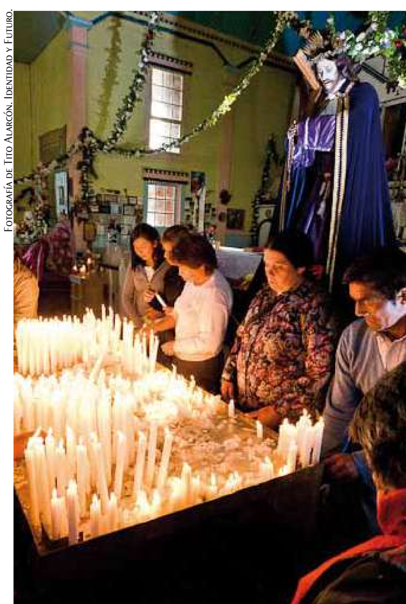
Velas votivas, banderas izadas por el viento insular y los tradicionales Pasacalles son parte de las procesiones de Caguach.