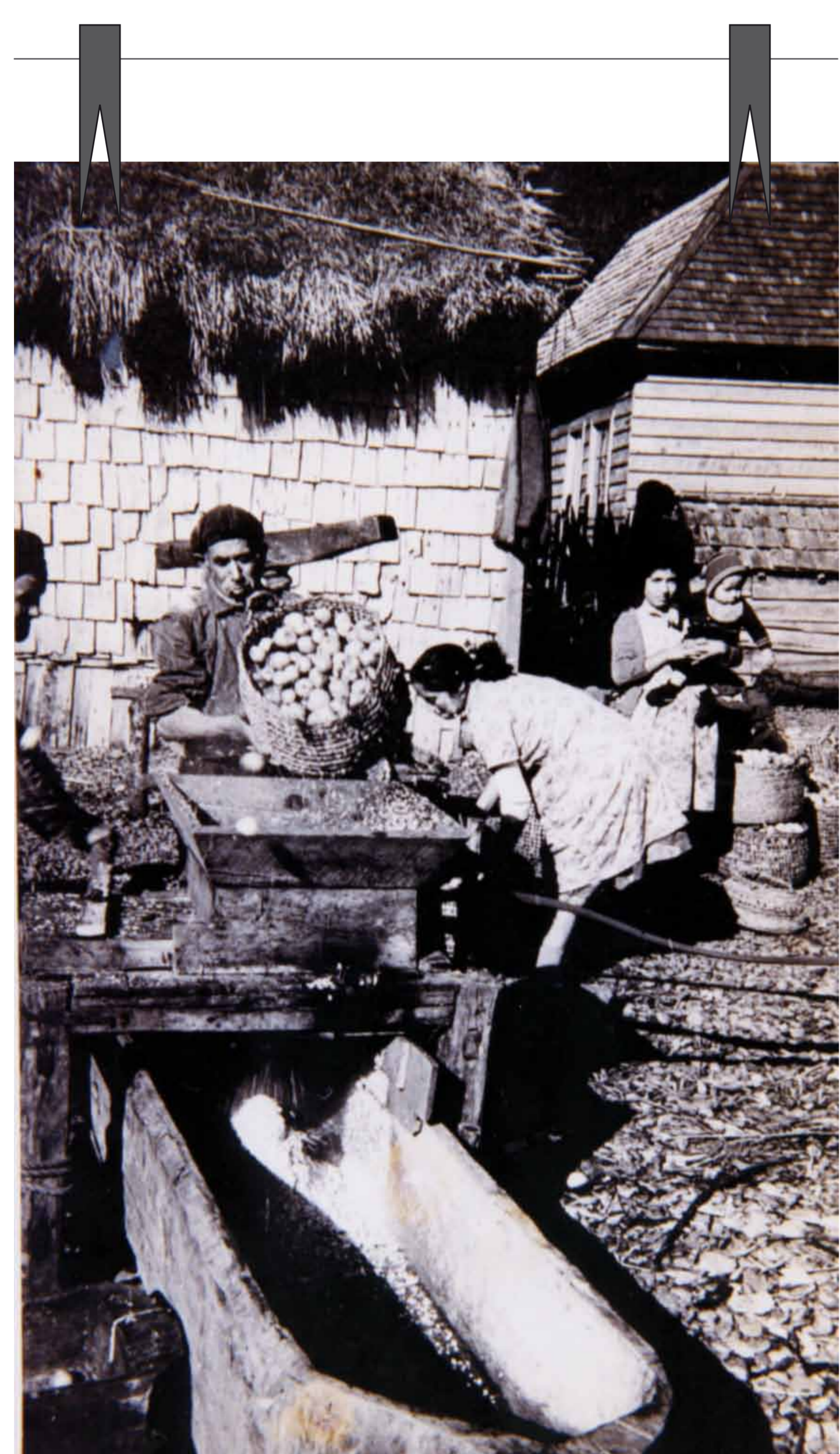
Maja para fabricar chicha. Tras la faena, los vecinos recibían su “yoco” como agradecimiento.