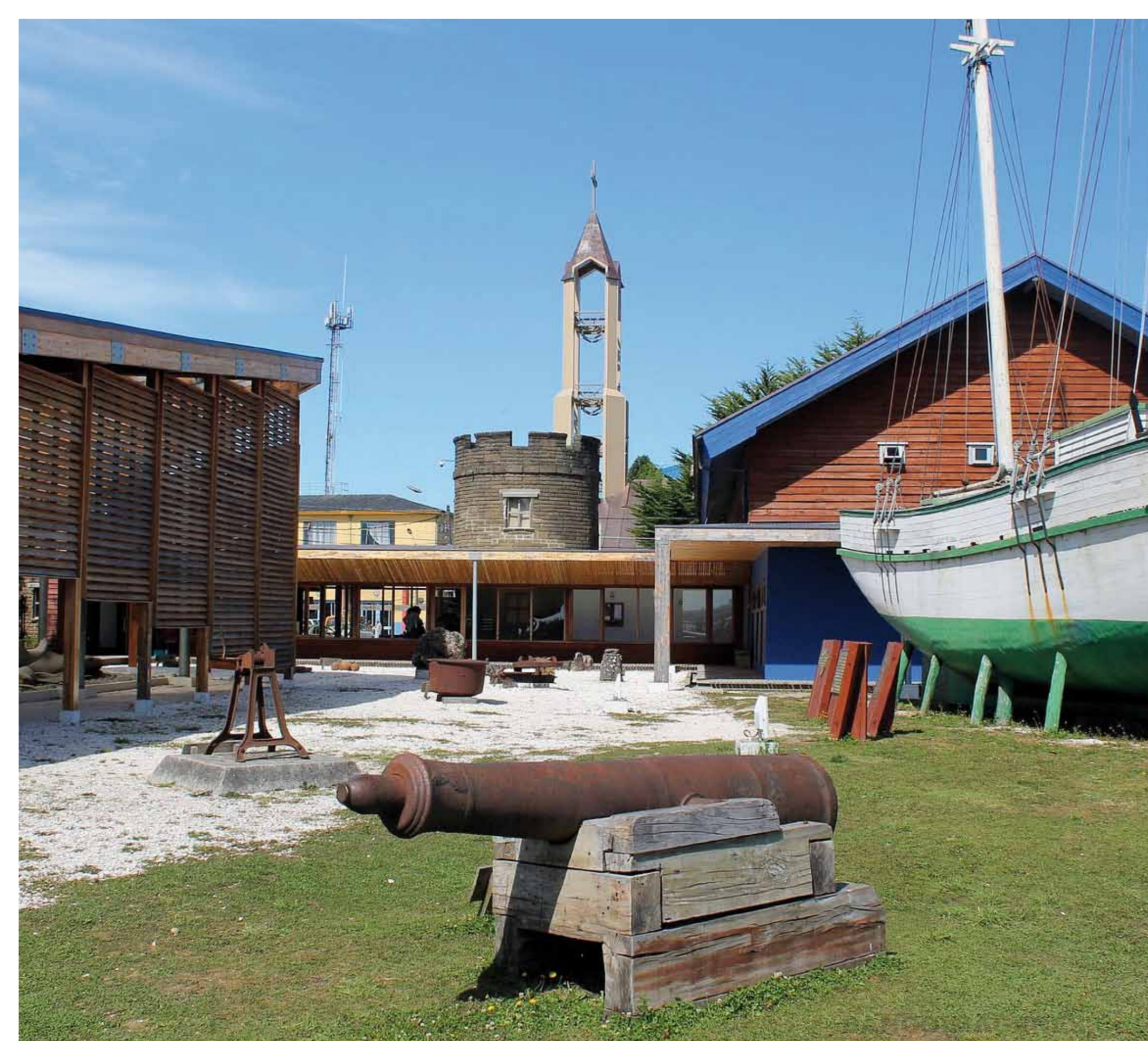
Patio del Museo Regional de Ancud.

Dos mil objetos dan vida a la colección del Museo Regional de Ancud. Esta muestra recorre Chiloé en más de seis mil años de historia desde Puente Quilo, el asentamiento de cazadores recolectores más antiguo de Chiloé, pasando por las pueblos originarios, la colonización española, la presencia de corsarios holandeses, la llegada de los jesuitas y la colonización europea de fines del siglo XIX, para culminar con el terremoto de 1960. En tanto, el Museo Municipal de Castro destaca por los variados artilugios que reflejan la "cultura de la madera" y el ingenio de los carpinteros chilotes.