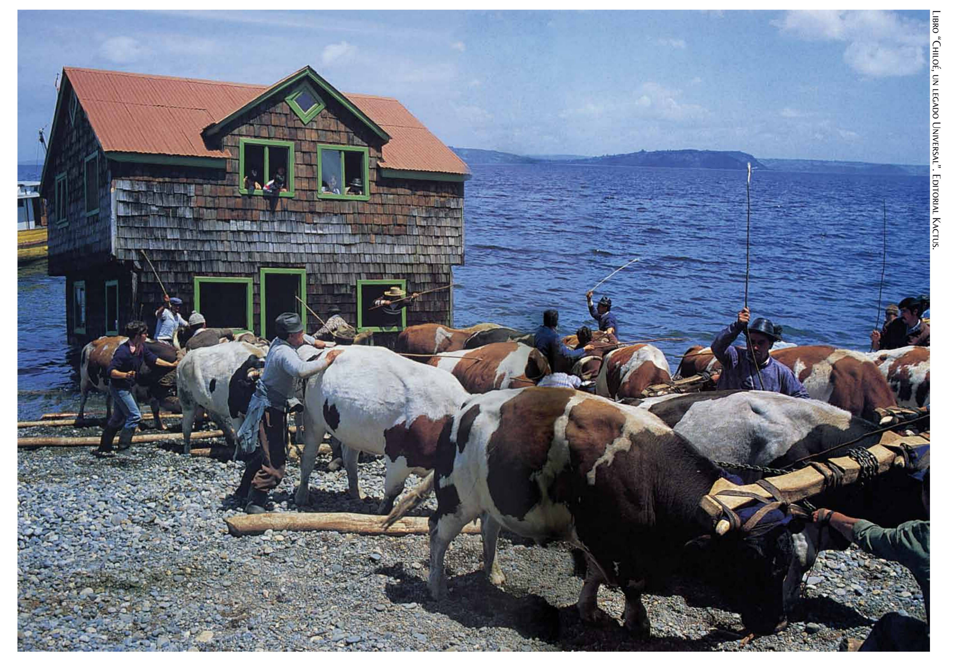
Por mar o por tierra, se pueden trasladar las casas chilotas.

La imagen de una casa navegando por los canales es tal vez la que mejor refleja el espíritu chilote, y es que cuando una familia se traslada, por ejemplo a otra isla, a veces lo hace con su propia casa. Para ello, “se suplica una minga”, se invita a un entendido a “amarrar la casa” y llegan también los vecinos a colaborar con sus yuntas de bueyes. Montan la casa sobre una alfombra de troncos y varas, para que comience a rodar hasta el bordemar. Luego ésta, que flota como balsa porque es de madera, es remolcada hasta su nuevo sitio. Después de este arduo trabajo colectivo, los “mingueros” celebran al estilo chilote: con cordero al palo, chicha de manzana y bailando periconas. Otras costumbres isleñas y comunitarias son el medán, la trilla, la maja y el reitimiento.