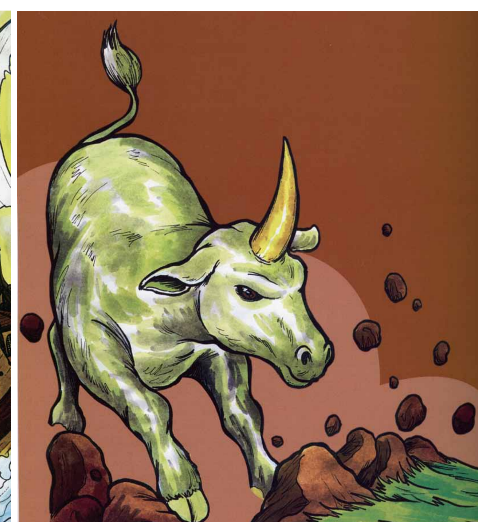
La mitología chilota es una de las más abundantes del país. De izquierda a derecha: ilustraciones del Caballo Marino, el Caleuche y el Camahueto.