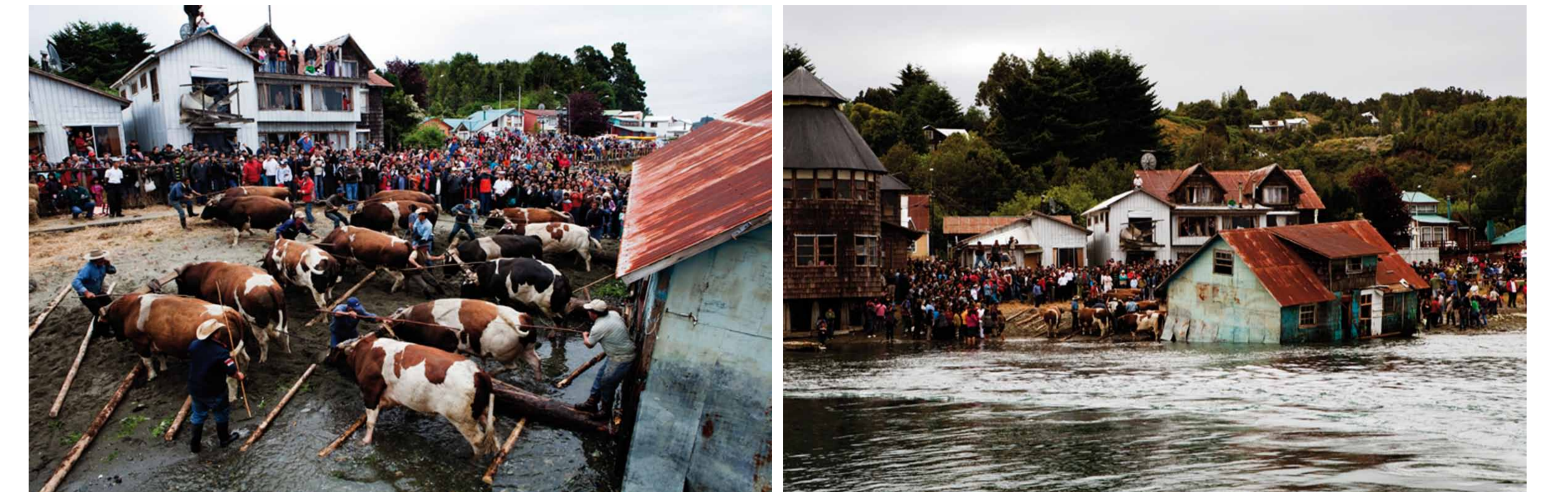
Minga de la antigua casa del escritor chilote Francisco Coloane, trasladada a Quemchi el año 2010.