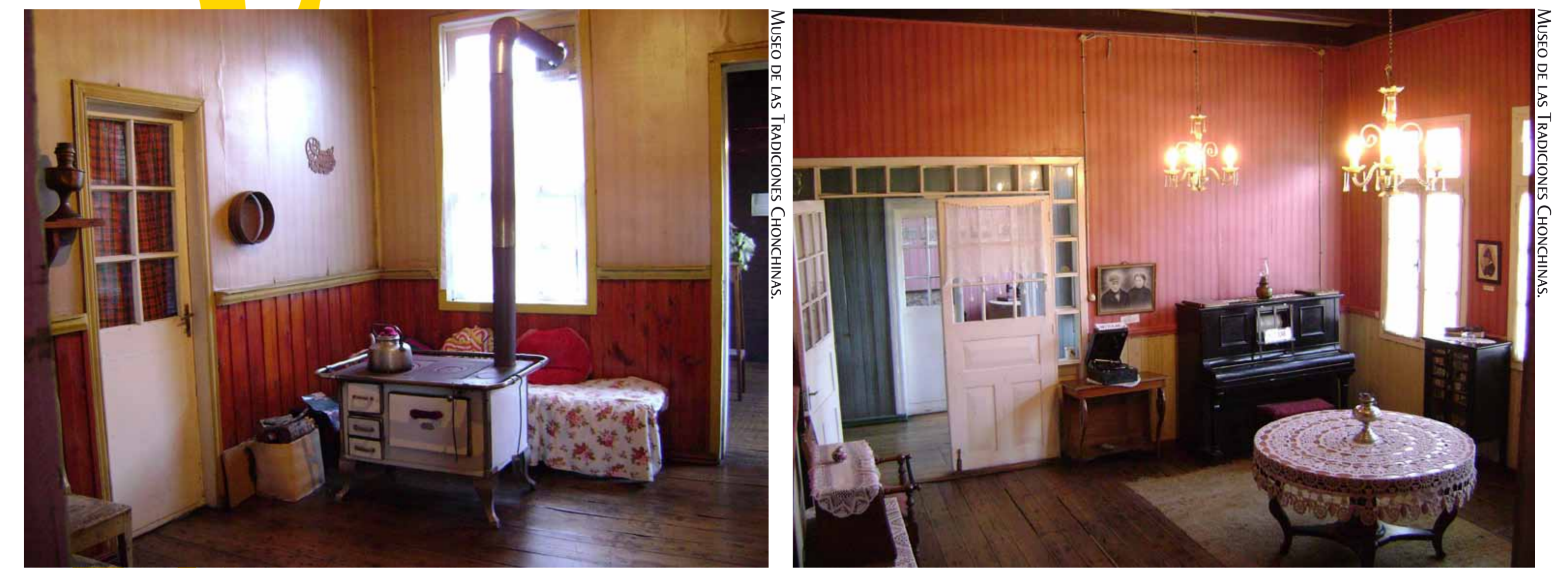
La cocina y el salón de una casa chilota son parte de la muestra al interior del Museo Viviente de las Tradiciones Chonchinas.