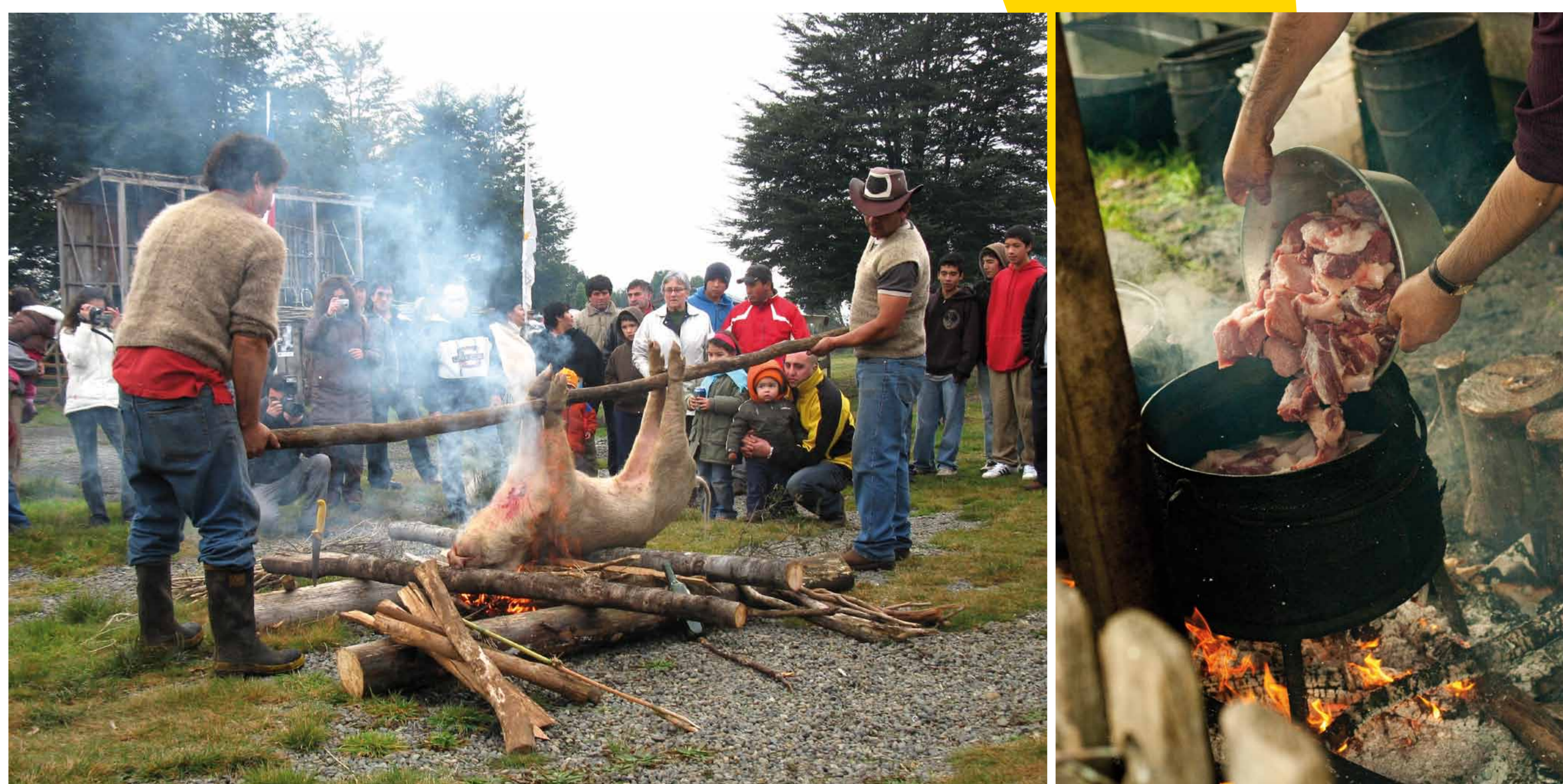
En Queilen, cada invierno se celebra la Fiesta del Reitimiento del Chanco para revivir esta ancestral tradición chilota.

Es todo un acontecimiento comunitario y campesino. Durante un año se “engorda” al chanco y, llegado el invierno, se realiza el carneo. Una vez muerto el cerdo, se quema con fuego de coleos (tallos secos de quila), se lava, descuartiza y desgrasa. Mientras los hombres trabajan en estas faenas, las mujeres limpian los tripales, pelan las papas y cuecen las coles para la morcilla. El día siguiente es el del reitimiento, en que se cocinan chicharrones, trozos de carnes, sopaipillas, milcaos y roscas en un gran caldero. Son servidos para todos los invitados y lo que sobra, lo reciben en un “ataíto” que prepara la dueña de casa.