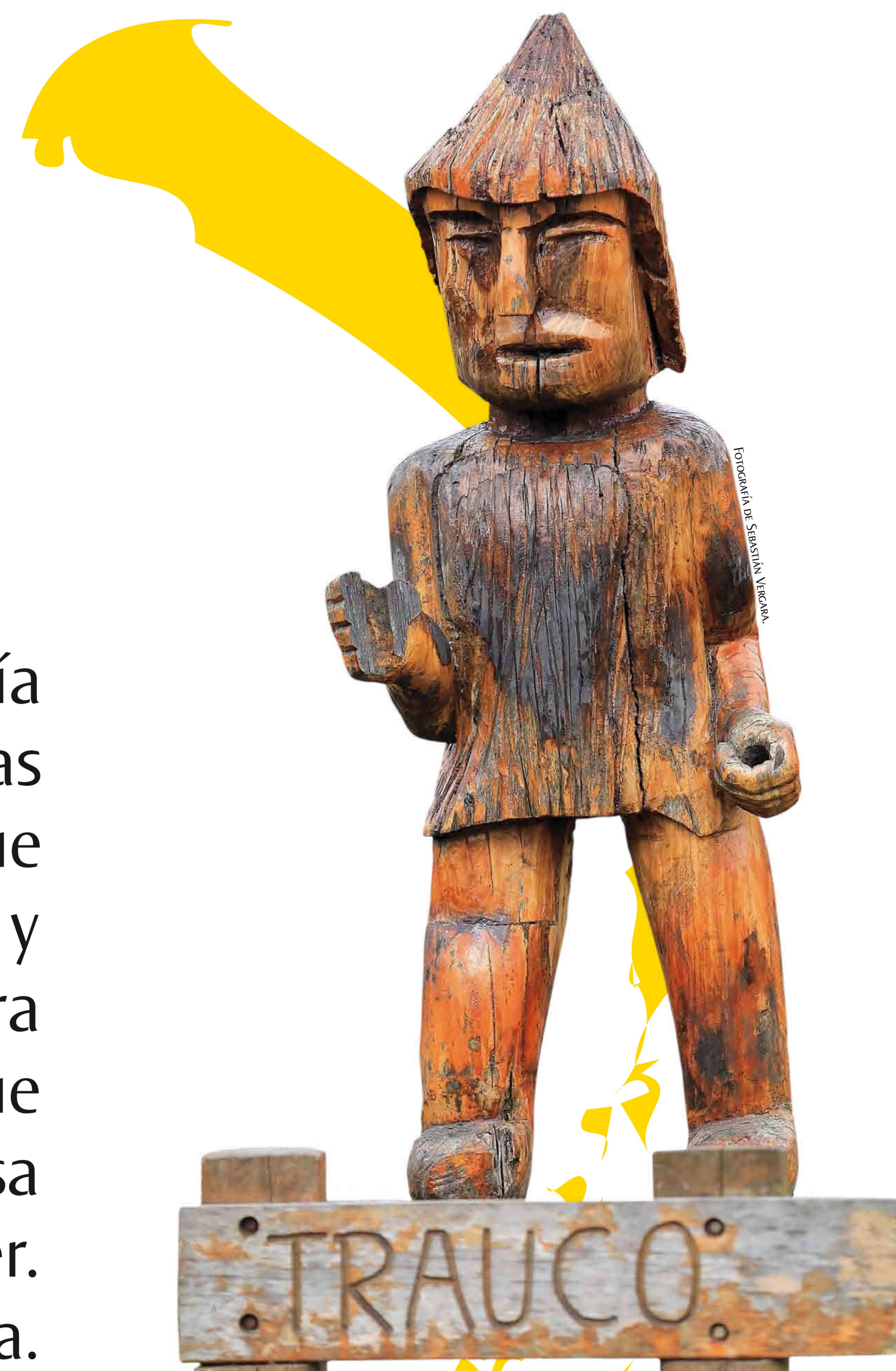
Esta escultura de madera del Trauco está en la ciudad de Quellón.

Son los principales personajes de la fructífera mitología chilota, fusión de las creencias de los pueblos originarios y las supersticiones españolas. Dicen que el Trauco es un enano que habita en los bosques, lleva un hacha de piedra y viste con traje y sombrero de quilineja. Cuentan que cuando una joven se encuentra con él, se adormece por la supuesta corriente magnética sexual que emana. La mujer, tras despertar del embrujo, regresa a su casa y nueve meses después nace un hijo de este misterioso ser. Por otro lado, está la poderosa sirena o ninfa llamada Pincoya. Cuentan que cuando baila frente al mar con su larga cabellera habrá abundancia en la pesca. Por el contrario, si baila dando la espalda al océano, alejará a los peces.