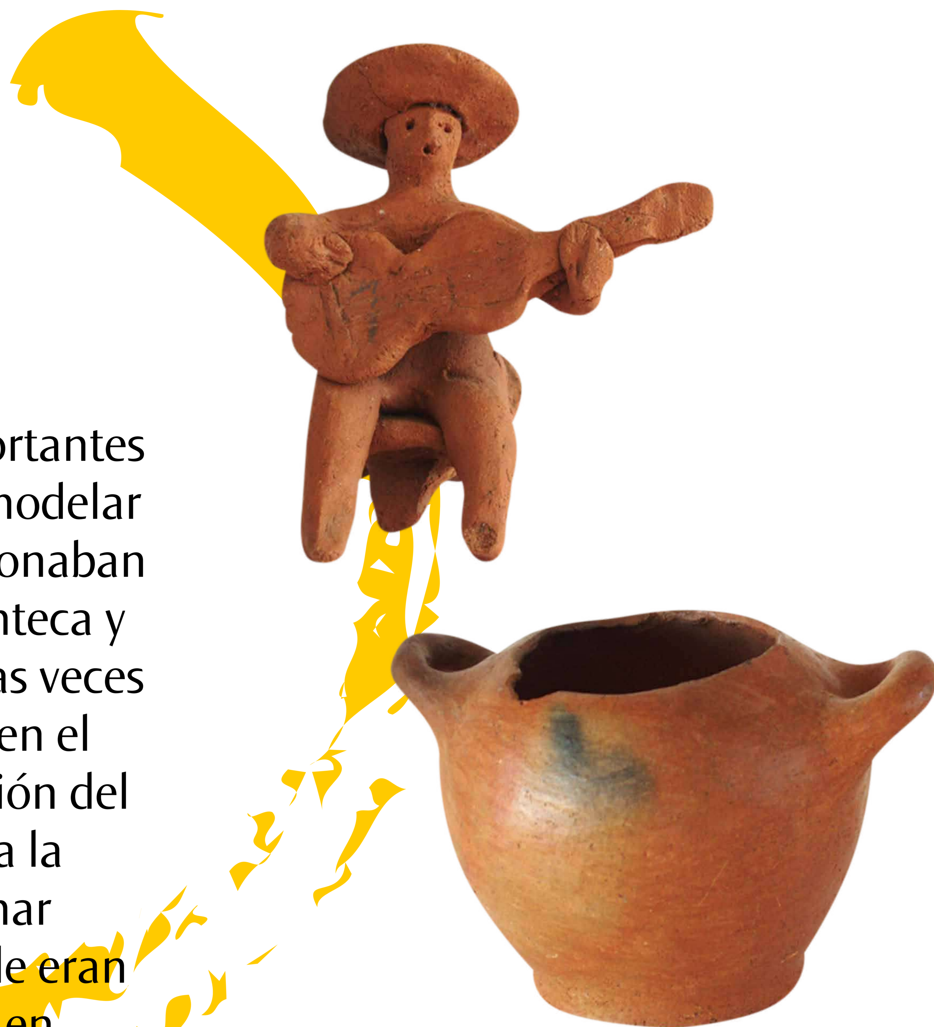
Antiguas vasijas y figuras de Caulín, en Ancud. Colección del Museo Regional de Ancud.

Durante el siglo XX, fueron los centros alfareros más importantes de Chiloé. En ambos, eran las mujeres las encargadas de modelar la greda con la ayuda de conchitas y piedras. Así, confeccionaban platos, jarros, ollas, lecheros, calderos, fuentes para la manteca y cayanas para tostar trigo. Las piezas más pequeñas muchas veces las hacían los niños para recrearse o ayudar a sus madres en el trabajo. En tanto, los hombres colaboraban con la extracción del barro en los pozos mineros y la preparación del fuego para la cocción de las vasijas. Una vez listas, las trasladaban por mar hasta Ancud, Castro, Achao, Carelmapu y Quinchao, donde eran vendidas en ferias y festividades religiosas. Iban envueltas en “chiguas”, contenedores hechos de fibra vegetal para evitar que se quebraran con el embate de las olas.