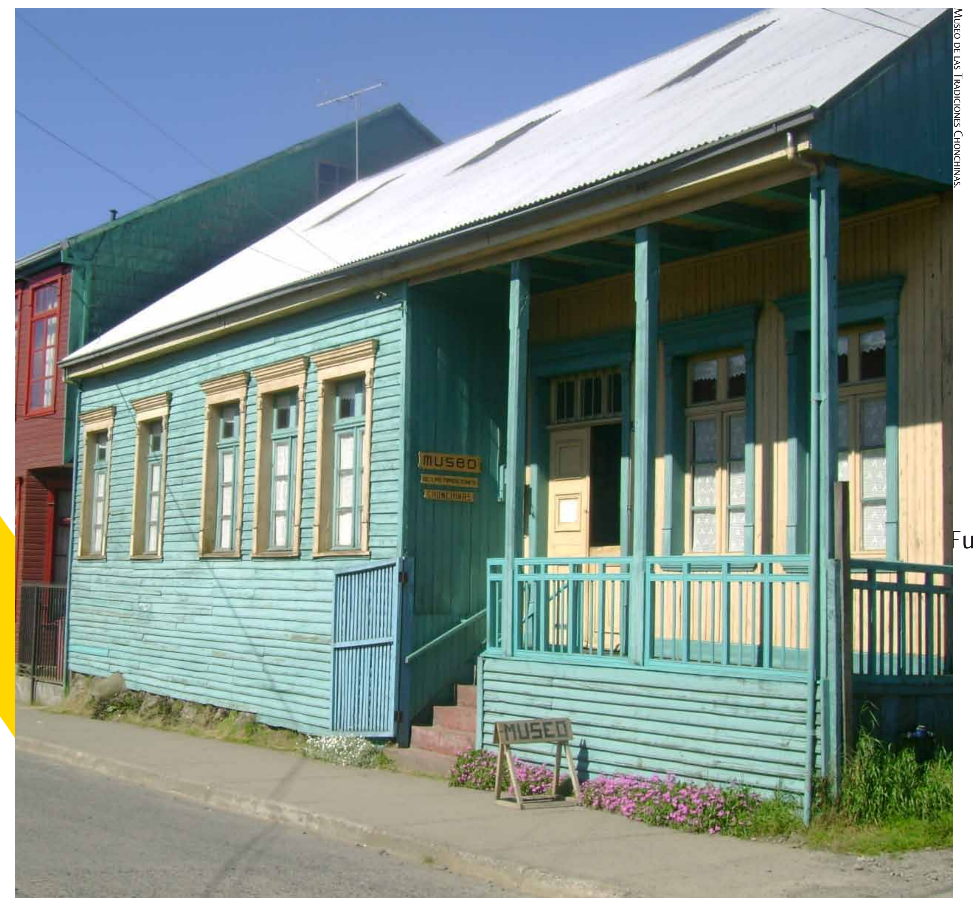
La casa en que se emplaza el museo data de 1910. Posee una colección de artefactos de uso cotidiano donados por los vecinos de Chonchi.

Como si fuera un hogar de principios del siglo XX, el Museo Viviente de las Tradiciones Chonchinas recibe a los visitantes con la mesa dispuesta, los dormitorios decorados con un reclinador para las oraciones diarias, el fogón chilote listo para funcionar como lo hiciera antaño y la sala de costura, donde la dueña de casa también solía tomar mate. Además, destaca el elegante salón con instrumentos musicales para amenizar los bailes de la época. El objetivo del museo, fundado en 1996, es mostrar cómo funcionaba una casa familiar y acomodada de acuerdo a las tradiciones y usanzas de la Isla. La vivienda, ubicada en calle Centenario, perteneció a un matrimonio chonchino y es un claro ejemplo de la arquitectura Neoclásica Chilota (1860-1920).