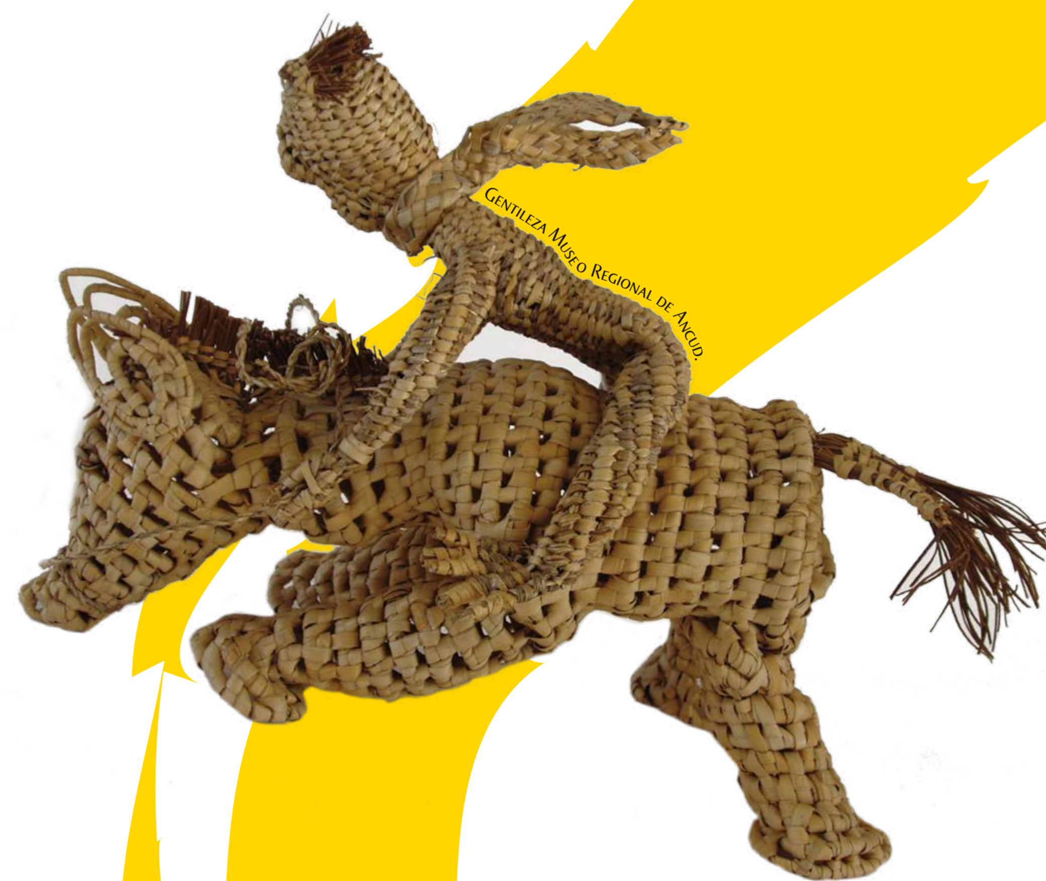
Estas figuras mitológicas se exhiben en el Museo Regional de Ancud, institución que ha llevado a cabo investigaciones sobre el origen de este tipo de cestería.