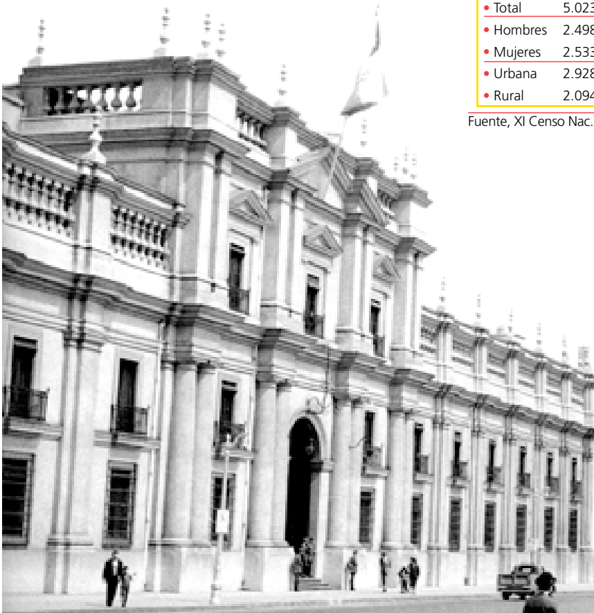
Palacio La Moneda, construido en 1805.