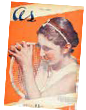
Revista As (1935).