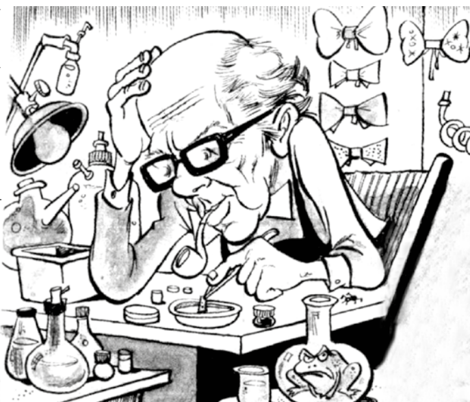
Ilustración publicada en La Tercera (24/5/1981).

“Se acepta con frecuencia que la labor del artista es diferente del quehacer científico. Se dice que el artista crea y el científico descubre. Que el papel de este último es ir quitando velos a la naturaleza para ir encontrando cosas que otros no ven. Pero, yo me pregunto ¿Son tan claro los límites entre creación y descubrimiento? ¿No es la creación artística también para ir quitando velos a la realidad para penetrar en ella más profundamente?”.