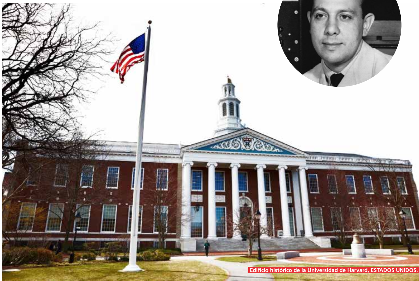
Edificio histórico de la Universidad de Harvard, ESTADOS UNIDOS.