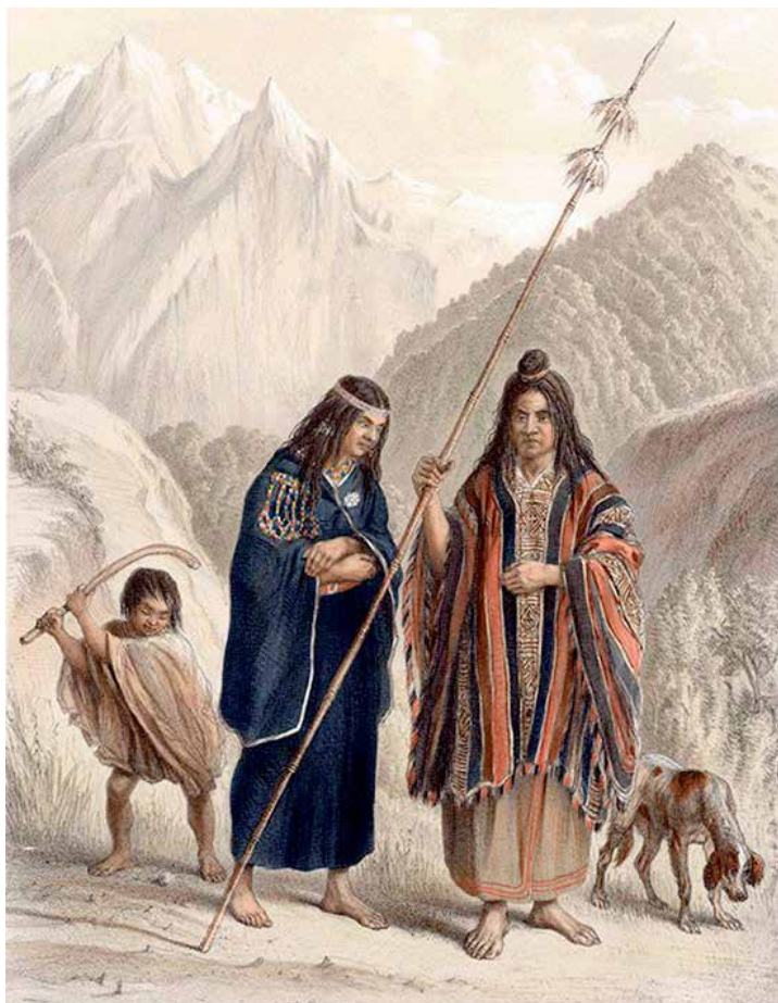
Araucanos (1854), ilustración de CLAUDIO GAY (1800-1873).

Su entorno fue el Wallmapu, que en mapudungun significa "territorio circundante". Fue allí donde nació en el siglo XVI y donde desarrolló –junto a la comunidad– su existencia en una "relativa" calma. ¿Por qué no absoluta? Pues, antes de la sorpresiva irrupción del conquistador peninsular al territorio de Chile en 1536, de cuando en vez había enfrentamientos entre la "gente de la tierra": los del Norte (picunches), de la Cordillera (pehuenches), del Sur (huilliches), de la Costa (lafquenches) y los del extremo sur (tehuelches). Pero nada se compara con el frontal choque cultural que significó el encuentro con el español...