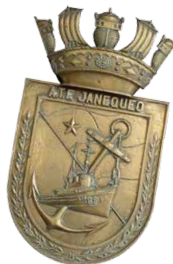
Escudo del escampavía ATF-65 Janequeo.