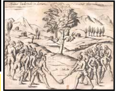
Ilustraciones del libro "Histórica Relación del Reyno de Chile y de las Misiones y Ministerios que exercita la Compañía de Jesús" (1646) de ALONSO DE OVALLE .

La Compañía de Jesús aportó grandes investigadores a la historiografía nacional: entre ellos el Abate Molina, Alonso de Ovalle y Diego de Rosales s.j. Este último en su vasta obra "Historia General del Reino de Chile, Flandes Indiano" (pública en Valparaíso 1877), se refiere a Janequeo. Nos cuenta que su nombre era Anuqueupu, que en mapudungun significa Anis "echar raíces" y Quepu "piedra negra". Si bien Rosales no da indicios de su fecha de nacimiento ni muerte, relata que –tras sus incursiones contra el español en Nahuelbuta– se habría retirado cansada (y quizás muy mayor) a vivir a Voipir, lugar que los peninsulares – cuando la fundaron por primera vez en 1552– bautizaron como Villarica. Luego los mapuche destruyeron Villarica, los españoles la refundaron en 1554, esta fue nuevamente destruída y, finalmente, en 1882, Villarica fue fundada por tercera vez. Esta sí fue la definitiva.