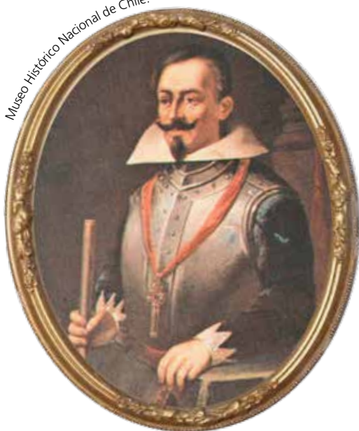
Gobernador Alonso de Sotomayor (1545-1610).

Cuando supo que los “huincas” (foráneo en mapudungun), por orden del Gobernador Alonso de Sotomayor, habían asesinado bajo tormentos a su esposo Huepotaén –el cacique de Llifén– Janequeo no lo dudó. Dedicaría sus horas y días a vengar la muerte de su hombre. Y no de cualquier forma. Lo haría con sagacidad y astucia única. Y con preparación militar...