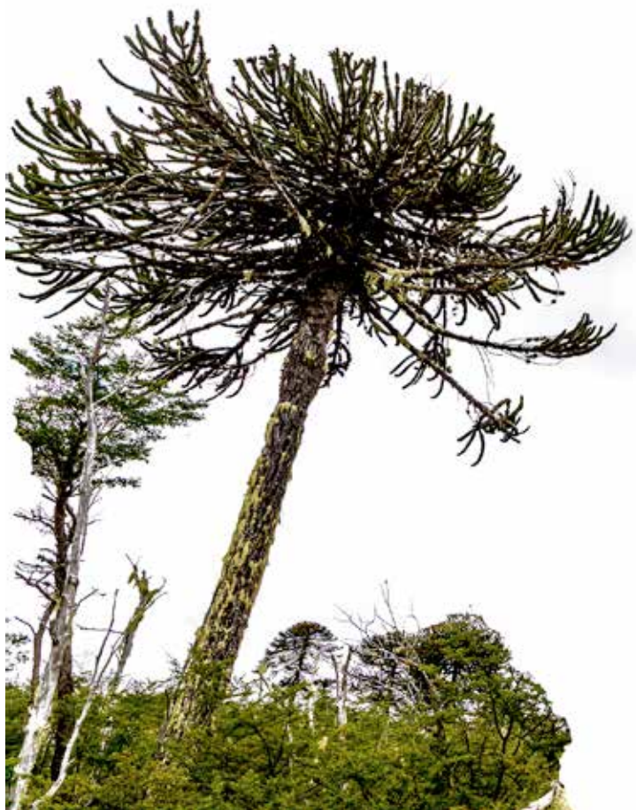
Parque Nacional Nahuelbuta, regiones de Biobío y Araucanía.

Hoy la cordillera de Nahuelbuta está dentro del Parque Nacional Nahuelbuta. Este forma parte de la red de 41 parques nacionales que actualmente administra la Corporación Nacional de Forestación (CONAF), creada en 1970.