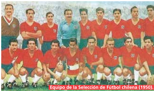
Equipo de la Selección de Fútbol chilena (1950).