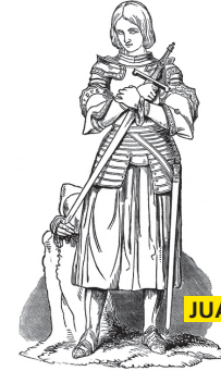
JUANA DE ARCO