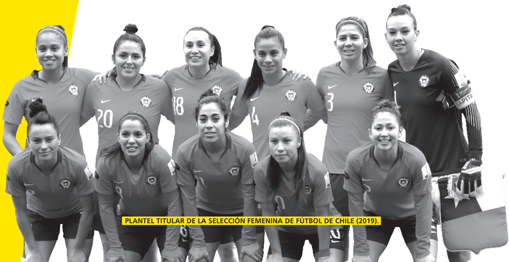
PLANTEL TITULAR DE LA SELECCIÓN FEMENINA DE FÚTBOL DE CHILE (2019).