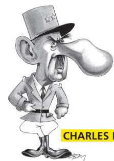
CHARLES DE GAULLE