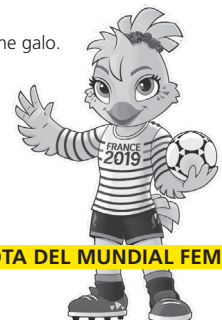
ETTIE, MASCOTA DEL MUNDIAL FEMENINO