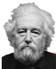
• TOMÁS MOULIAN (1939-)

Este matrimonio de filósofos y académicos de la Universidad de Concepción, fueron creadores de la Sociedad Chilena de Filosofía.